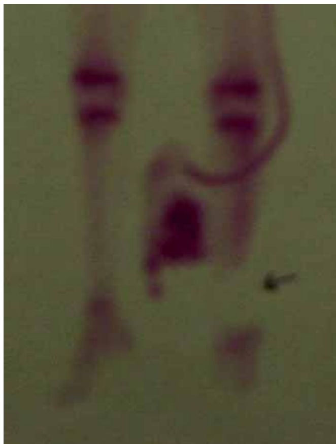
Fig. 3: Gammagrafía ósea para delimitar nivel de vascularización en pierna izquierda.

A los 11 días de hospitalización se realizó al paciente una gammagrafía ósea en la que observamos falta de vascularización del segmento tibio-peroneo de los tercios medio y distal de la pierna izquierda (Fig. 3), examen que orienta efectivamente sobre la