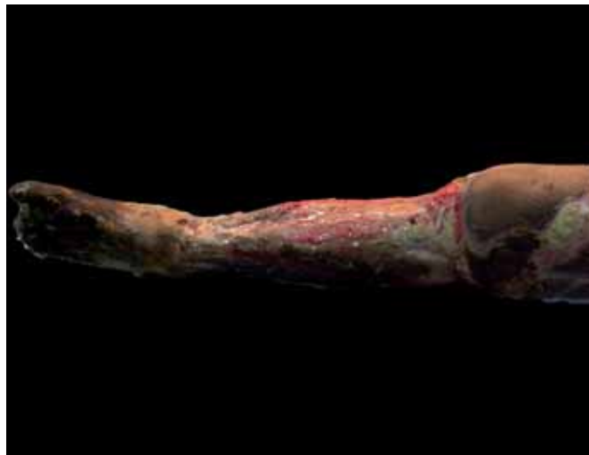
Fig. 2: Imagen al ingreso de la extremidad inferior izquierda.

Electrocardiograma: microvoltajes con alteración de la repolarización.