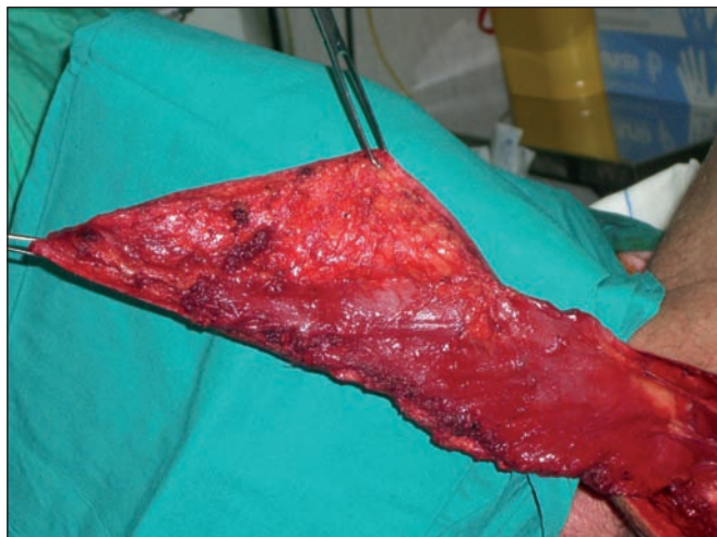
Fig. 4: Colgajo fasciomiotómico de trapecio extendido donde se aprecia su pedículo vascular.