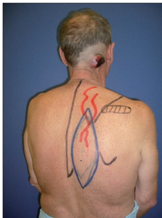
Fig. 2: Marcaje y diseño del colgajo.