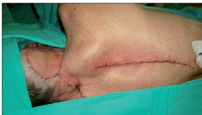
Fig. 5: Colgajo posicionado en el área receptora y cierre del área donante.

El postoperatorio transcurrió sin incidencias. No fue necesario ingreso en la Unidad de Cuidados Intensivos; el drenaje de la región donante fue retirado a las 48 horas y el de la región receptora a los 5 días; finalmente el paciente fue dado de alta.