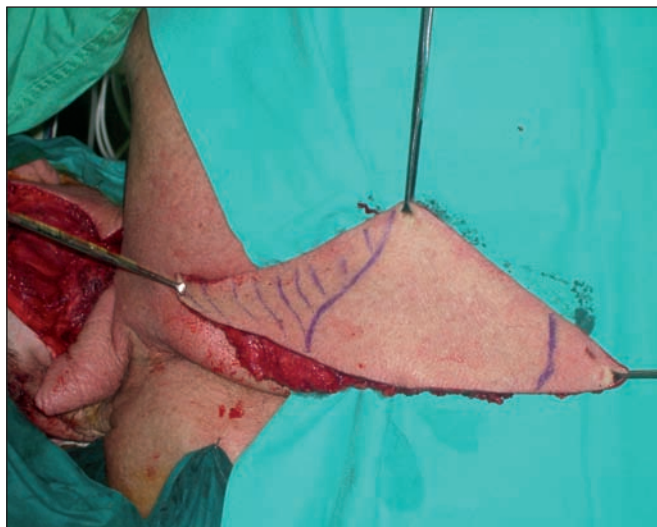
Fig. 3: Colgajo elevado del lecho donante.

Realizamos marcaje preoperatorio de colgajo de trapecio extendido tomando como límites los anteriormente descritos, diseñando una isla cutánea de 8 cm de anchura por 24 cm de longitud, de manera que los 2/3 inferiores de la misma estaban fuera del territorio del músculo trapecio (Fig. 2 y 3). En la figura 4 se aprecia el pedículo vascular del colgajo en el borde vertebral de la escápula. La figura 5 muestra el cierre de la zona donante y el posicionamiento del colgajo en el área receptora. Para la resección tumoral dejamos un margen de 2 cm.