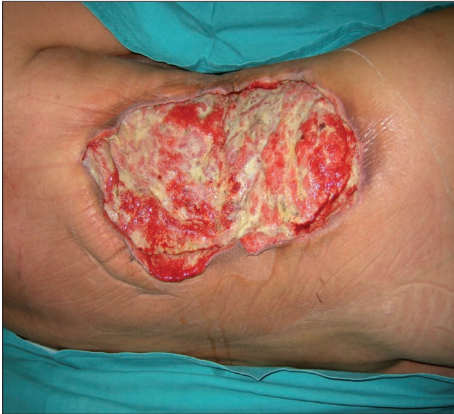
Fig. 5. Día 7 - Aspecto tras 2 curas con Sistema VAC ©