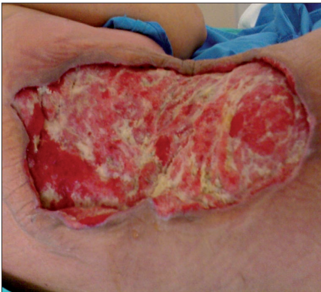
Fig. 6. Día 13 - Aspecto tras 5 curas con sistema VAC ©

Una vez limpia, granulada y libre de infección la zona problema (13 días después del desbridamiento), se procedió a su cobertura mediante injertos autólogos de piel de espesor parcial asociados de nuevo a terapia VAC® (KCI Clinic Spain, S.L.) con apósito Granofom a 125 mmHg durante 10 días, realizándose la primera cura al cuarto día y luego cada 48 horas (Fig. 7). En la primera cura tras injerto evidenciamos que éste estaba adecuadamente prendido y sin signos de complicación aguda tipo hematoma o infección, hecho que motivó la retirada del tratamiento antibiótico y el reinicio del tratamiento inmunosupresor suspendido, según recomendación de Nefrología.