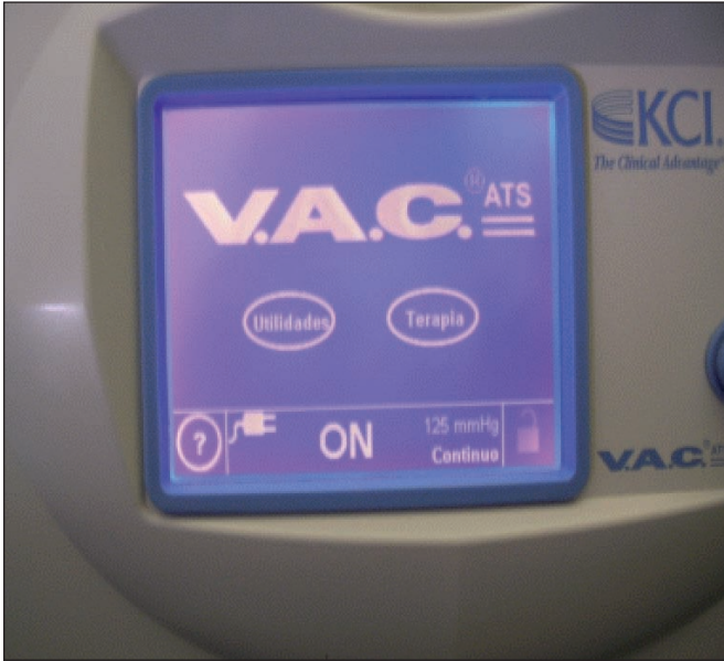
Fig. 4. : Día 3 - Terapia Continua a 125mmHg