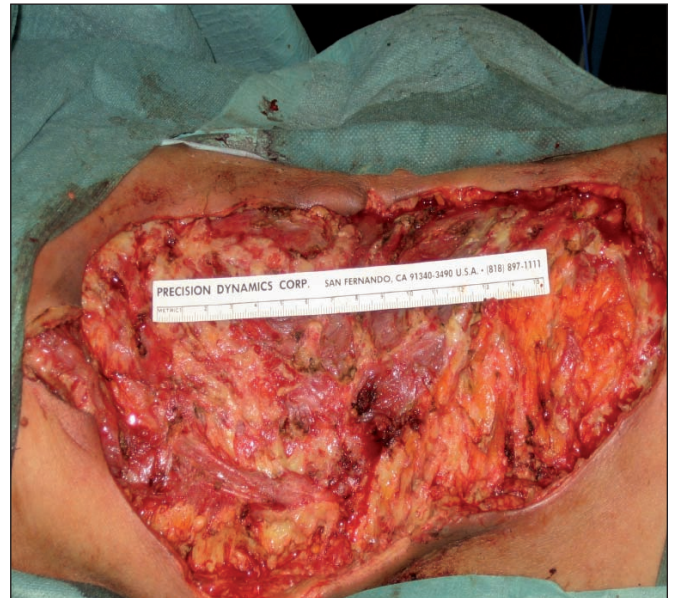
Fig. 2. Día 1- Desbridamiento Quirúrgico.

Ante la sospecha clínica de fascitis necrosante se decide iniciar terapia antibiótica intravenosa (IV) y realizar desbridamiento quirúrgico inmediato hasta plano muscular, sin incluirlo, abarcando un área de aproximadamente 25 X 25 cm en flanco y parrilla costal derechos (Fig. 2). Ajustamos el tratamiento inmunosupresor, manteniendo solamente Prograf (Tacrolimus) y suspendiendo Micofenolato y Dacortín e iniciamos tratamiento antibiótico intravenoso de amplio espectro con Ciprofloxacino (400 mg/12 horas), Teicoplanina (400 mg/12 horas), Clindamicina (600 mg/6 horas) y Tobramicina (50 mg/12 horas). Las muestras obtenidas para cultivo dieron positivo para Escherichia Coli. Tras el desbridamiento, se inició tratamiento con terapia de presión negativa con sistema VAC® durante 13 días a 125 mmHg y curas cada 48 horas (Fig. 3-6).