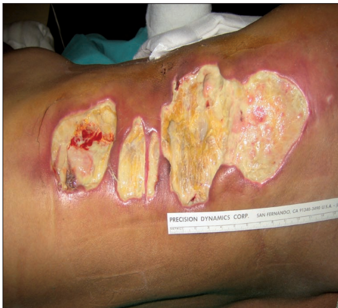
Fig. 1. Fascitis necrosante en paciente de 24 años al 4º día de postoperatorio de trasplante renal. Día 1- Biopsia y Cultivo

Mujer de 44 años de edad con antecedentes médicos de insuficiencia renal crónica en tratamiento con hemodiálisis desde el año 2005. En abril del 2010 es sometida a un trasplante renal de donante cadáver, previo tratamiento inmunosupresor. Al cuarto día de postoperatorio la paciente presenta fiebre, empeoramiento del estado general y lesiones eritematosas en flanco derecho, que rápidamente evolucionan con aparición de flictenas y necrosis cutánea. El servicio de Nefrología cursa biopsia y cultivo de las lesiones y solicita colaboración de nuestro Servicio (Fig. 1).