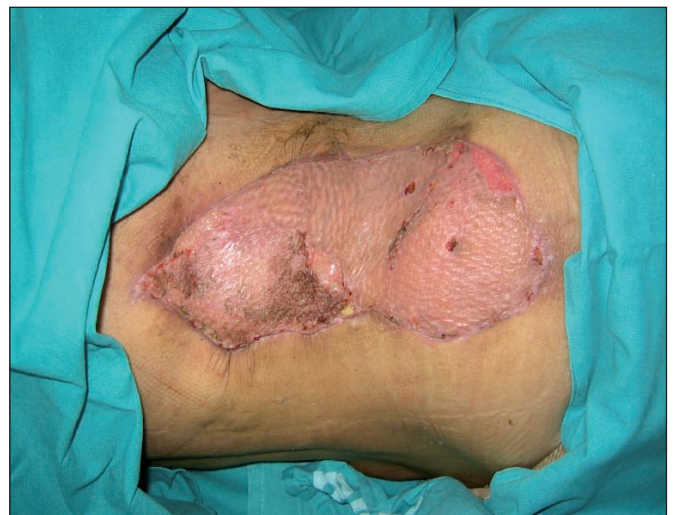
Fig. 8. Aspecto a los 25 días postinjerto piel parcial + terapia VAC ©.

Transcurridos 24 días de hospitalización, la paciente fue dada de alta por nuestro Servicio y siguió en régimen de curas oclusivas ambulatorias mediante tulgraso antibiótico y gasas impregnadas en povidona yodada (Fig. 8). La primera cita en consulta externa de Cirugía Plástica se hizo a las 2 semanas del alta hospitalaria (18 días postinjerto), momento en el que encontramos la zona problema curada. A los 6 meses, realizamos un control evolutivo (Fig. 9).