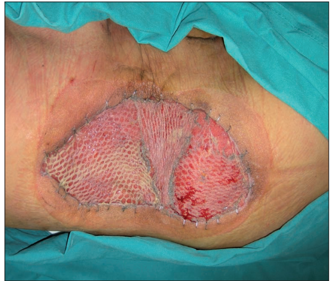
Fig. 7. Día 23-10 días tras injerto de piel parcial + terapia VAC ©.

Una vez limpia, granulada y libre de infección la zona problema (13 días después del desbridamiento), se procedió a su cobertura mediante injertos autólogos de piel de espesor parcial asociados de nuevo a terapia VAC® (KCI Clinic Spain, S.L.) con apósito Granofom a 125 mmHg durante 10 días, realizándose la primera cura al cuarto día y luego cada 48 horas (Fig. 7). En la primera cura tras injerto evidenciamos que éste estaba adecuadamente prendido y sin signos de complicación aguda tipo hematoma o infección, hecho que motivó la retirada del tratamiento antibiótico y el reinicio del tratamiento inmunosupresor suspendido, según recomendación de Nefrología.