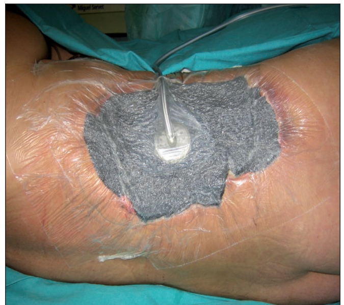
Fig. 3. Día 3- Inicio Terapia VAC®