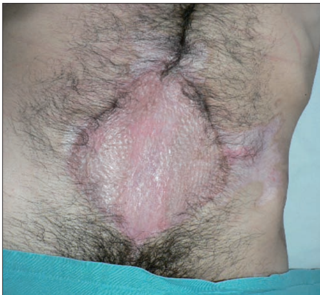
Fig. 3. Resultado final: injerto dermoepidérmico mallado sobre colgajos de músculo recto abdominal.

Las quemaduras son lesiones que se producen en los tejidos vivos debido a la acción de diversos agentes físicos: fuego, líquidos u objetos calientes, radiación, corriente eléctrica, frío, etc., que provocan alteraciones que van desde un simple eritema hasta la destrucción total de las estructuras. Existen también agentes químicos (cáusticos) y biológicos que pueden producir lesiones similares (4,5).