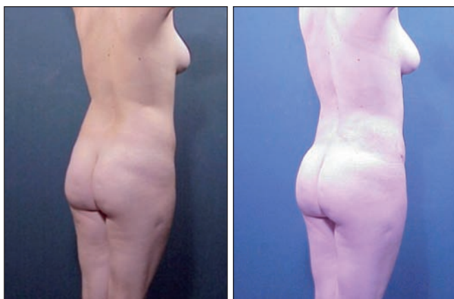
Fig. 21 y 22. Pre y postoperatorio a los 2 años tras liposculptura infiltrando 300 cc de grasa autóloga en cada glúteo.