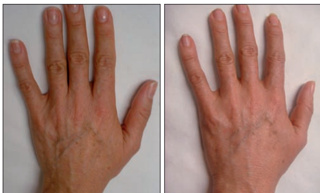
Fig. 17 y 18. Rejuvenecimiento de manos con infiltración en cada una de 10 cc de grasa en forma de microinjertos. Postoperatorio a los 3 meses.