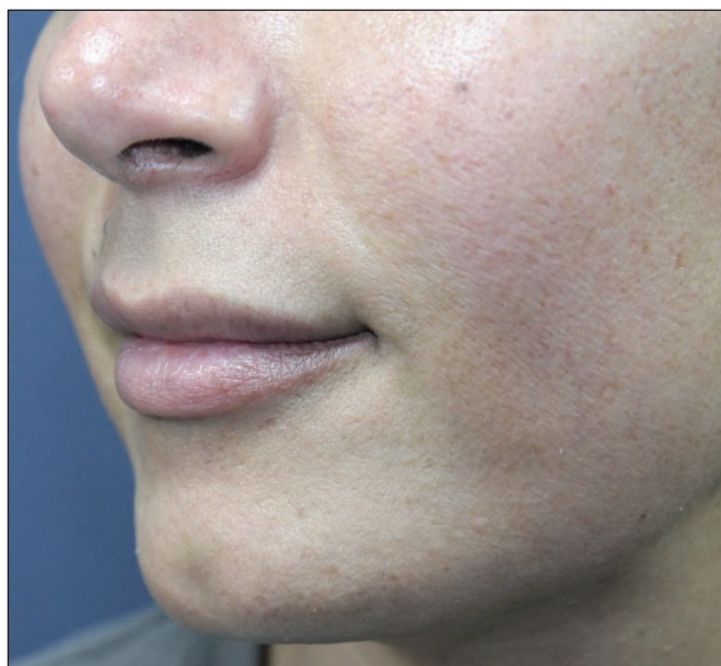
Fig. 13 y 14. Infiltración de microinjertos grasos en ambos labios para lograr delineado y aumento de los mismos: 2,5 cc en labio superior y 3 cc en labio inferior. Postoperatorio a los 6 meses.