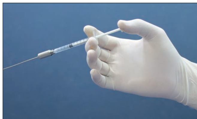
Fig. 8. Jeringas de 1 ml para inyectar los microinjertos con microcánulas romas de 16 o 18 G.