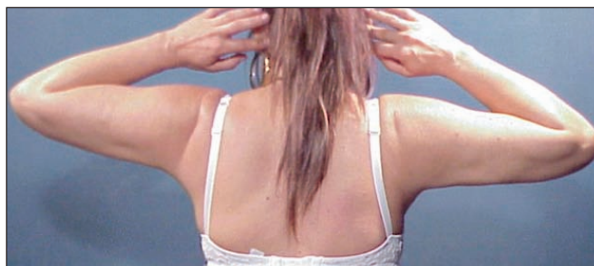
Fig. 23 y 24. Macroinjertos grasos en parte posterior de ambos brazos para corregir secuelas de liposucción. Inyección de 90 cc en brazo derecho y 75 cc en brazo izquierdo. Postoperatorio al año.