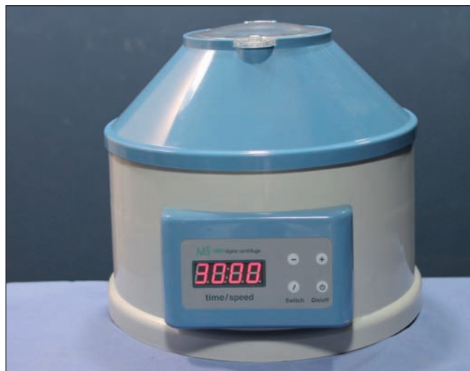
Fig. 6. Centrifugadora utilizada para preparar los microinjertos: 3 minutos a 3.000 rpm.

romas de 3 mm con un solo orificio en la punta (Fig. 7). Si son microinjertos empleamos jeringas de 1 a 3 cc con microcánulas romas de 16 o 18 G (Fig. 8). Esta diferencia se basa en los planos de infiltración y las necesidades que deben cubrir cada uno de ellos. Los macroinjertos se inyectan a través de las mismas incisiones empleadas para la liposucción o a través de pequeñas incisiones hechas con bisturí en las zonas apropiadas, mientras que los microinjertos se infiltran a través de incisiones realizadas con aguja hipodérmica de 18 G, por lo que el punto de acceso en este caso será prácticamente imperceptible.