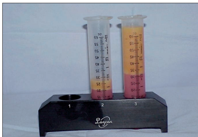
Fig. 5. Tras eliminar el tejido conectivo, en los macroinjertos separamos el líquido de la grasa por decantación del material liposuccionado.

En el caso de macroinjertos, usamos para la infiltración en el lecho receptor jeringas de 60 cc y cánulas