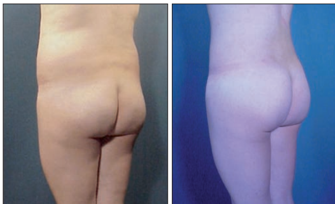
Fig. 19 y 20. Mejoría del contorno glúteo mediante extracción de grasa en cintura y región lumbar e infiltración total de grasa en región glútea y trocánterea de 550 cc en forma de macroinjertos. Postoperatorio a los 2 años.