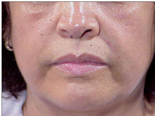
Fig. 9 y 10. Paciente a la cual le fueron colocados 2,5 cc y 3 cc de grasa en forma de microinjertos en surco nasogeniano derecho e izquierdo respectivamente. Postoperatorio a los 6 meses en el que vemos la mejoría mantenida de ambos surcos.