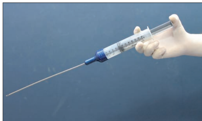
Fig. 7. Jeringas de 60 cc con cánulas romas de 3mm de un solo orificio para la inyección de macroinjertos.

El plano de colocación de los injertos grasos es muy variable; puede hacerse en planos superficiales o profundos, y aunque hace años infiltrábamos en el plano muscular, actualmente evitamos en la medida de lo posible, la infiltración de grandes cantidades de grasa en el tejido muscular y predominantemente infiltramos en el tejido adiposo del área receptora y en el tejido muscular superficial, lo que percibimos al ver cómo se contrae el músculo correspondiente en el momento de introducir la cánula. El motivo es que hemos realizado estudios de investigación en los que hemos encontrado que la grasa infiltrada en el músculo puede difundir más rápido en la economía corporal a través del torrente circulatorio. La introducción de grasa en el torrente circulatorio, aunada a otros factores coadyuvantes, puede condicionar la aparición de un síndrome de embolismo graso, o en el peor de los casos, de una embolia grasa (20).