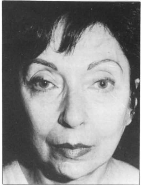
Figura 16.—Vista de frente. Preoperatorio. Paciente de 62 años. Se le practicó un lifting de cara, blefaroplastia y inyección de grasa en surcos nasogenianos, labio superior, e inferior y menton.