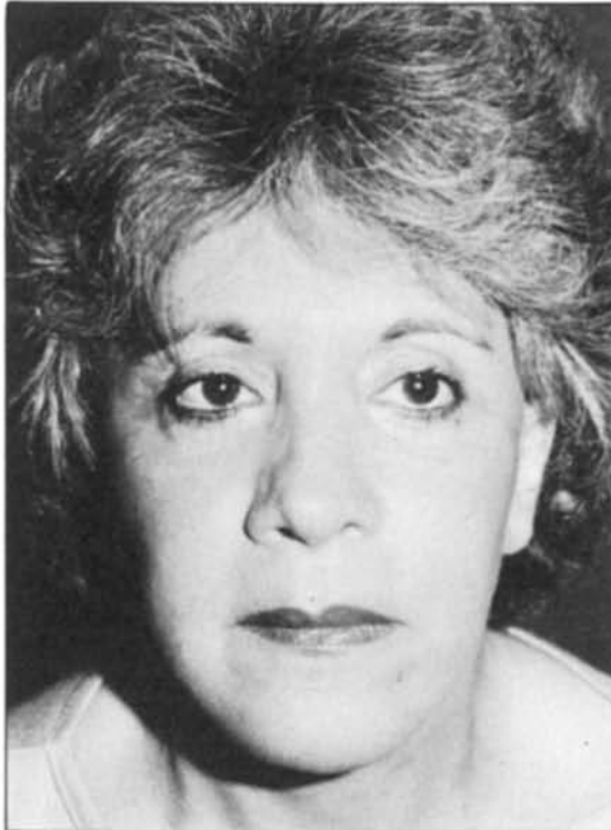
Figura 9. Imagen posoperatoria a los treinta días. Es evidente la redondez de la cara y la desaparición de los surcos nasogenianos, relleno de la región glabellar y de la región malar.

Figure 9.—Frontal postoperative view one month after surgery. Note the improved appearance of the face specially in glabellar, mental and nasogenial areas.