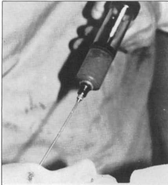
Figura 3.—Trocar y jeringa diseñados por los autores para la inyección de la grasa, en este caso se inyecta en región glabelar.