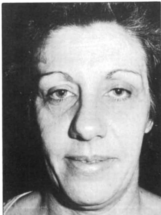
Figura 13. -- Vista de frente. Preoperatorio.

Figure 12. -- Fat injection in the area.