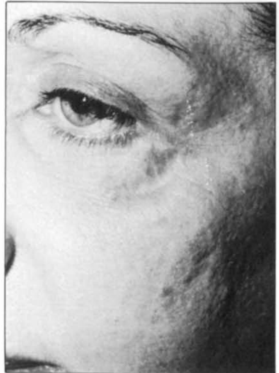
Figura 10. --Paciente que muestra zonas deprimidas en el párpado inferior, una cicatriz traumática hundida.

Figure 9.—Frontal postoperative view one month after surgery. Note the improved appearance of the face specially in glabellar, mental and nasogenial areas.