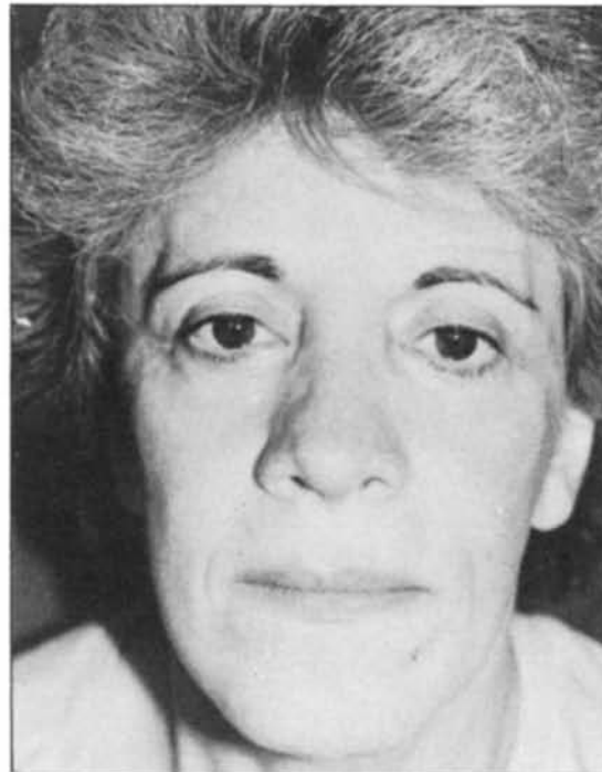
Figura 8.—Vista frontal. Preoperatorio. Nótese la depresión de los surcos nasogenianos.

Figure 7.—Lateral preoperative view. Note the depressed malar region.