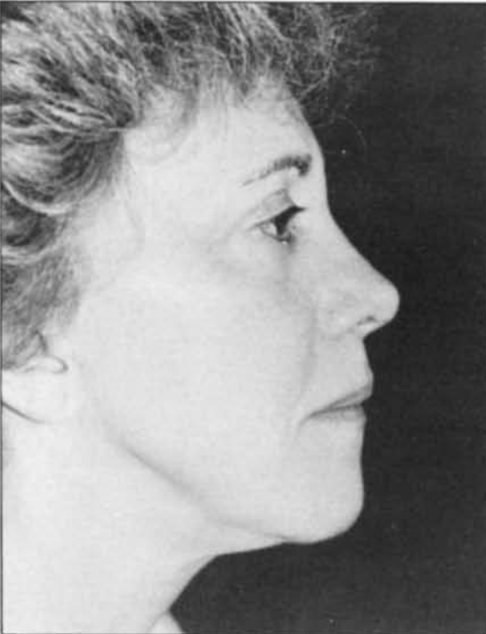
Figura 7.—Preoperatorio. Vista de perfil. Nótese el hundimiento de la región malar.

Figure 6.—Lateral view. Note the preauricular suture of the rhytidectomy and the improved appearance of the zygomatic region.