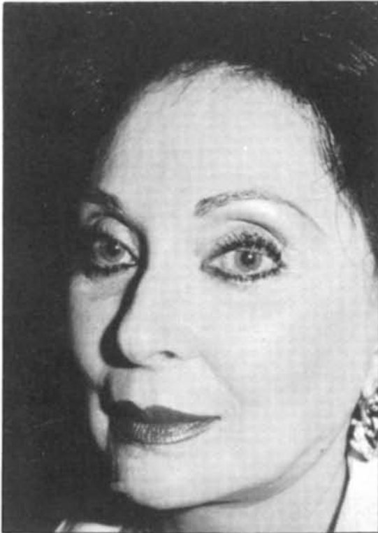
Figura 21. - Vista oblicua posoperatorio. La mejora del aspecto tras la inyección de grasa es evidente.