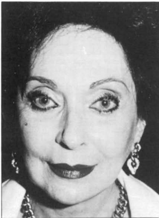
Figura 17.—Vista de frente un año después del tratamiento. Figure 17.—One year postoperative frontal view.