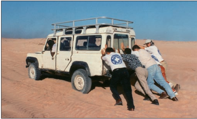
Fig. 1. Empujando el jeep en el desierto de Mauritania, 1997.