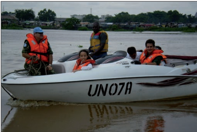
Fig. 5. Navegando por el río Congo con tropas de las Naciones Unidas.