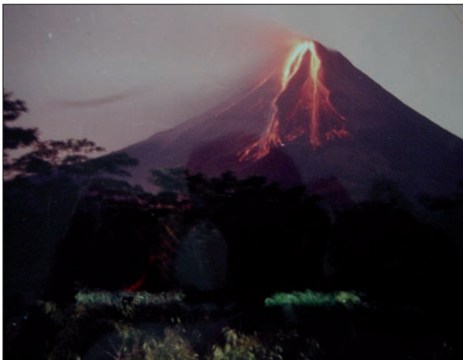
Fig. 2. El volcán Merapi (Indonesia) en erupción tras el terremoto de 2006.