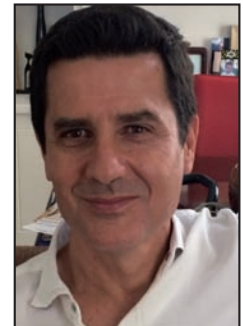
Fernández Palacios, J.