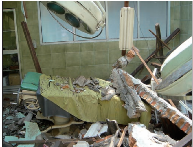
Fig. 9. Quirófano afectado por terremoto, Yogyakarta (Indonesia), 2006.

Durante la Guerra de los Balcanes nuestra intervención se realizó en los meses de enero de 1995 y 1996 gracias a la tregua que allí impone el crudo invierno y que