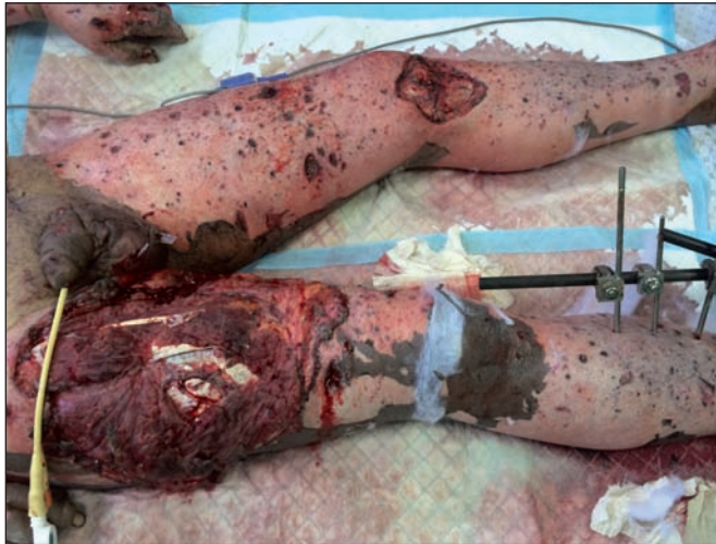
Fig. 10. Herido por bomba: quemaduras, fracturas y heridas por metralla. Gaza, 2014.

venciones de desbridamiento como único acto quirúrgico, 21 de desbridamiento y cobertura con injertos, 2 cierres directos y 9 colgajos (paraescapular, lateral del brazo, inguinal, antebraquial tipo Elliot, Quaba, Hueston, safeno, rotación en cuero cabelludo y un wrap around aquíleo); todos estos colgajos fueron muy apreciados por los cirujanos locales que tenían así la oportunidad de conocerlos. Mención especial merecen los pacientes con heridas por metralla, en los que teníamos que explorar una a una la infinidad de heridas presentes por todo su cuerpo. A veces más de 100. Todos estos grandes destrozos musculares requerían desbridamientos muy amplios, al igual que las amputaciones traumáticas altas. Al no poder aplicar un manguito de isquemia, empleábamos clampaje temporal de la arteria femoral durante la cirugía.