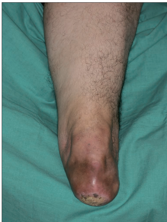
Fig. 5. Paciente de 42 años. Muñón infracondíleo tras amputación por osteosarcoma a los 17 años de edad. Ulceras de repetición con drenaje de contenido purulento.

A los 3 meses de la intervención el paciente tuvo que suspender el proceso de rehabilitación por la aparición de unas lesiones verrucosas dolorosas en la transición