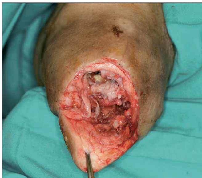
Fig. 6. Desbridamiento. Infección en canal medular del fémur.