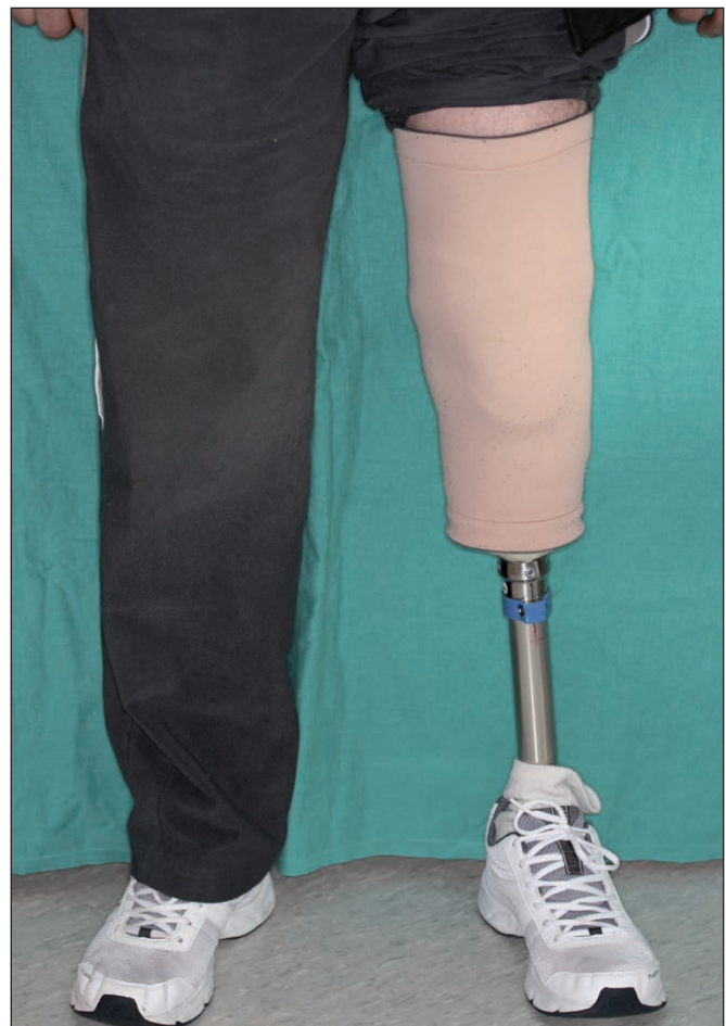
Fig. 8. Resultado funcional sobre la prótesis a los 14 meses de la reconstrucción.