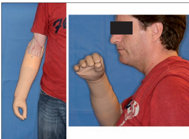
Fig. 4. Resultado funcional a los 20 meses con flexo-extensión de codo conservada y prótesis correctamente adaptada.

cubrimos el defecto con un colgajo ALT del muslo contralateral, de 8 cm de anchura x 20 cm de longitud, el cual revascularizamos con la arteria genicular descendente y