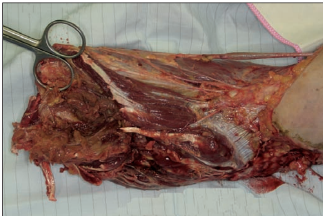
Fig. 2. Aspecto después del desbridamiento.