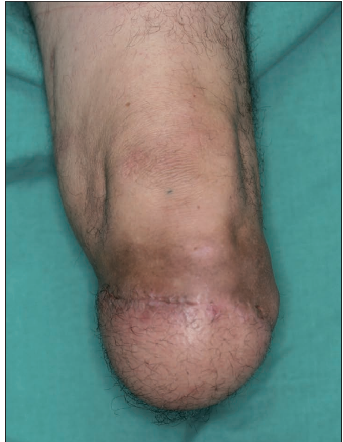
Fig. 7. Colgajo ALT sobre el muñón.

Desde su introducción en el año 1973 (5), la transferencia de colgajos libres se ha convertido en una herramienta útil y ampliamente empleada, casi de rutina, en todo tipo de reconstrucciones. Su aplicación para el rescate de muñones de amputación ha sido descrita por varios autores (6). A pesar de las publicaciones, este abordaje no es frecuente para cobertura de defectos del muñón de amputación, siendo la práctica habitual la de subir el nivel de amputación y cerrar el muñón dada la simplicidad de esta técnica frente a la reconstrucción mi-