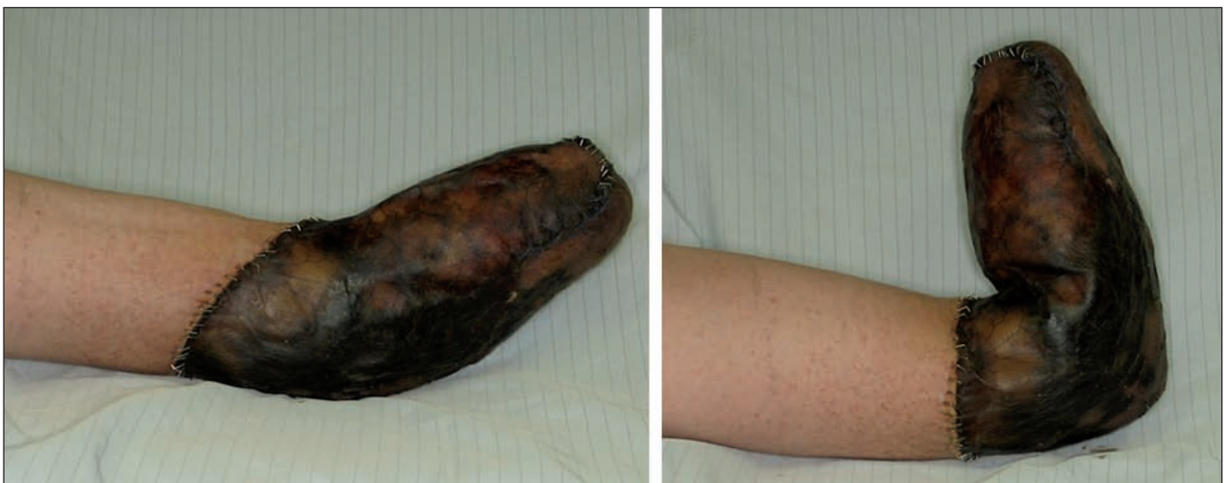
Fig. 1. Varón de 33 años. Necrosis cutánea circular de la porción distal del muñón de amputación con conservación de una correcta movilidad del codo.

Tras resecar la piel ulcerada y realizar un desbridamiento exhaustivo de la cavidad medular de la tibia, extirpar la piel circundante y los tejidos blandos afectos,