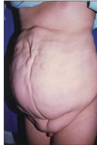
Fig. 1. Varón de 8 años de edad con disminución de músculos de la pared abdominal, tórax corto, disnea, y constipación intestinal.

En el seguimiento clínico, a los 14 años el paciente no presentaba complicaciones urológicas, con uroculti-