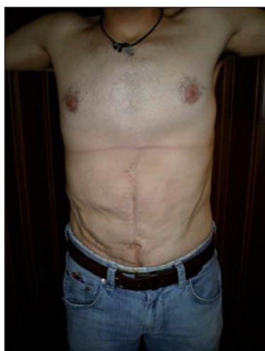
Fig. 5. Postoperatorio al año con mejoría del tono muscular y notable mejoría estética del abdomen.

dejando de atender en muchos casos el problema estético abdominal (3).