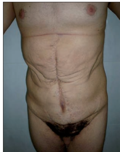
Fig. 3. El paciente a los 23 años de edad, momento en que solicita mejoría estética abdominal. Presenta debilidad del hemiabdomen derecho y disminución del tono muscular.

vos negativos, creatinina sérica de 0,8mg/dl y urodinamia con capacidad vesical de 650ml (ideal= 500ml). A los 23 años de edad (Fig. 3), el paciente presenta caracteres sexuales secundarios desarrollados, sin síntomas urológicos ni digestivos. En este momento solicita una mejoría estética abdominal.