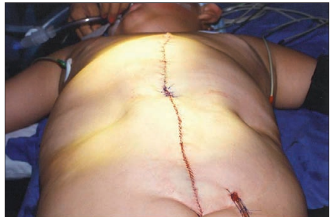
Fig. 2. Paciente intervenido mediante técnica de Montfort eliminando una elipse superficial de piel desde apéndice xifoides hasta pubis. Esta elipse de piel fue desepitelizada dejando tejido graso y cicatriz umbilical.