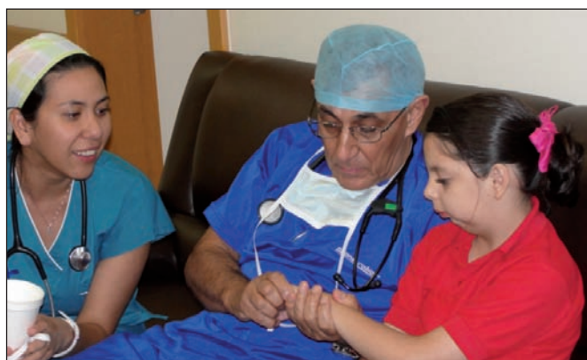
Fig. 11 y 12. Grupo de trabajo y valoración por Anestesiología en la Campaña de Mexicali, Baja California, año 2014.