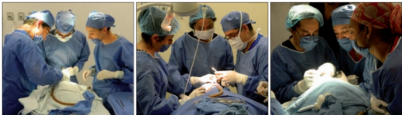
Fig. 3, 4 y 5. Equipo quirúrgico en la Campaña de Tacubaya, México D.F. año 2013.