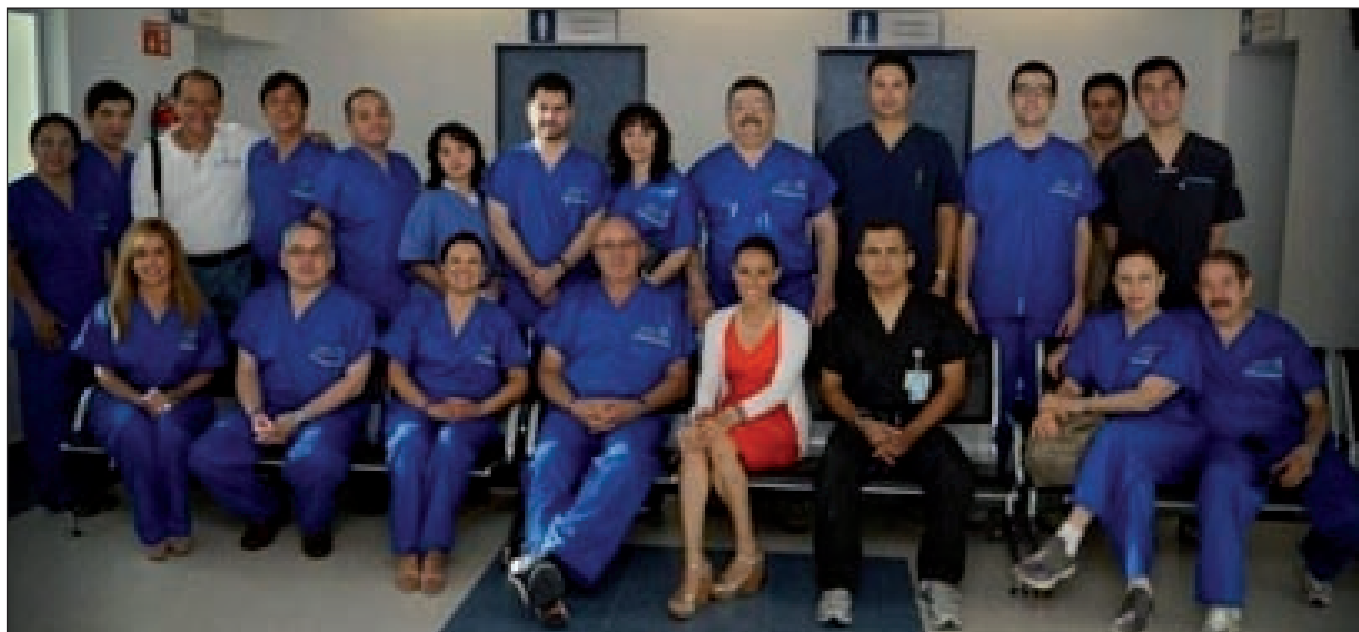
Fig. 2. Grupo de trabajo en la Campaña de Puerto Vallarta, Jalisco, año 2013.

Meses más tarde, en la capital del país, se buscó el apoyo de los hospitales de la Secretaría de Salud del Distrito Federal y se logró realizar en el Hospital Pediátrico de Tacubaya, una campaña donde de manera electiva se valoraron 40 pacientes que ya se encontraban en lista de espera, con un tiempo de espera para cirugía de aproximadamente 1 año, para finalmente operar a 20 niños. Se realizaron 24 procedimientos quirúrgicos, 23 de ellos por patologías congénitas (Fig. 3-5).