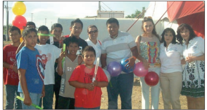
Fig. 27. Voluntariado, cuerpo médico y administrativo en interacción con los pacientes durante las campañas.