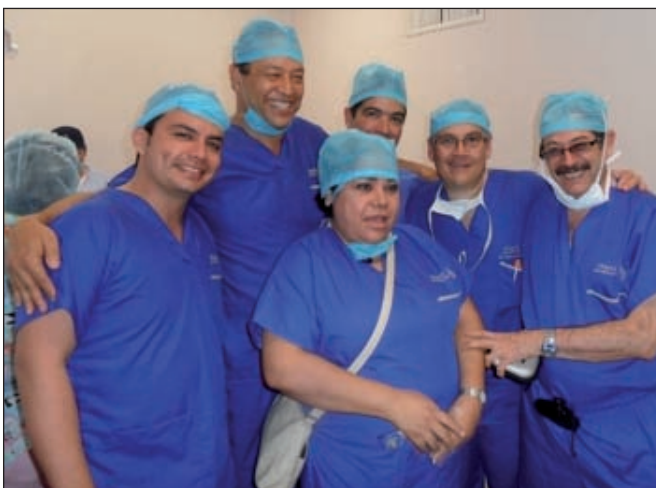
Fig. 7 y 8. Valoración de pacientes y equipo quirúrgico en la Campaña de Veracruz, Veracruz, año 2013.