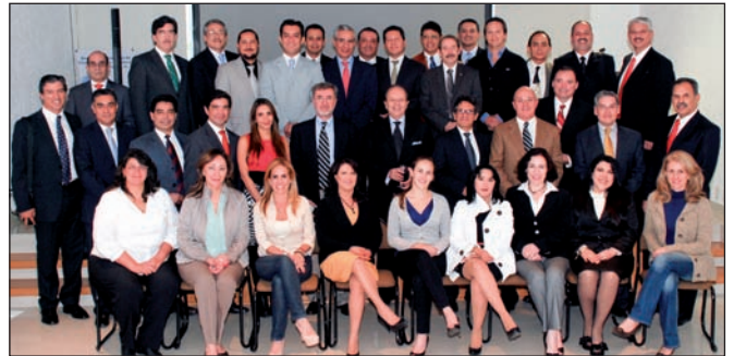
Fig. 1. Miembros fundadores de la FUNCIPLAS año 2012.