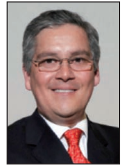
Vallarta Rodríguez A.

Vallarta-Rodríguez A.*, Morales-Olivera J.M.**, Duarte y Sánchez A.***