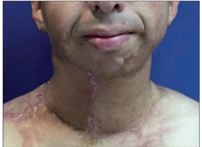
Fig. 22. Postoperatorio tras múltiples procedimientos quirúrgicos. Importante mejoría a nivel cervical anterior.