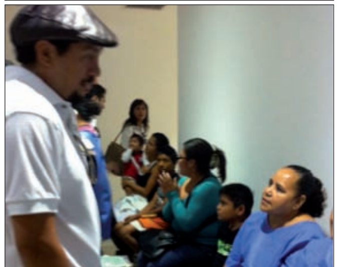
Fig. 9 y 10. Grupo de trabajo y valoración de pacientes en la Campaña de Playa del Carmen, Quintana Roo, año 2013.