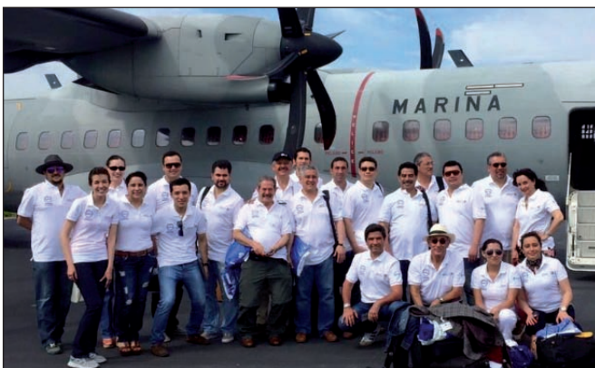
Fig. 17 y 18. Grupo de trabajo en la Campaña de Puerto Vallarta, Jalisco, año 2015.