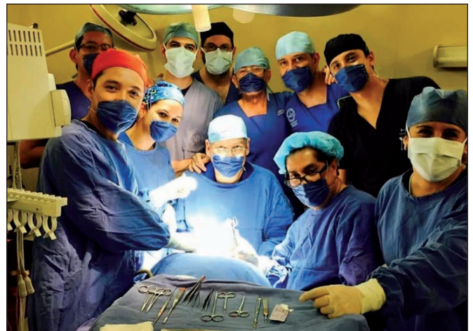
Fig. 28. En quirófano durante la última campaña realizada en Mazatlán, Sinaloa, noviembre de 2015.

nadas a la educación, calidad de vida o salud, entre otros objetivos (16). La FUNCIPLAS forma parte de ese grupo de organismos que pretende, entre otros muchos objetivos, lograr que la salud sea un poco más universal (Fig. 27 y 28).