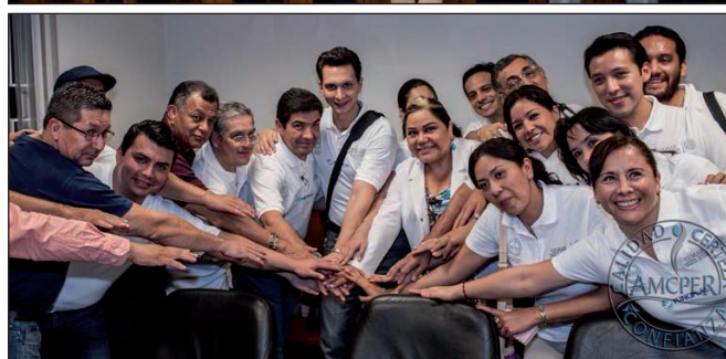
Fig. 15 y 16. Grupo de trabajo e inicio de la Campaña de Veracruz, Veracruz, año 2014.