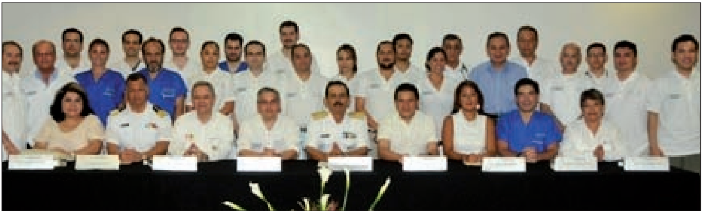
Fig. 6. Primero Simposium de Cirugía Reconstructiva en la Campaña de Veracruz, Veracruz, año 2013.