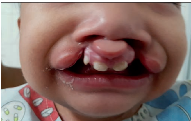
Fig. 10. Paciente de 3 meses de edad con labio y paladar hendidos bilateral, al que se le realizó queiloplastia y plastia nasal.

después de la cirugía el paciente estará incomodo al caminar, pero sabiendo que en una semana ya estará recuperado para caminar con normalidad.