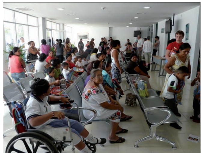
Fig. 3. Pacientes en un domingo de la jornada quirúrgica, durante la valoración preoperatoria.