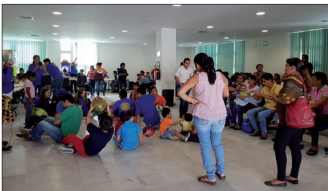
Fig. 1. Pacientes en espera de ser atendidos cada primer lunes de mes en la Clínica de Labio y Paladar Hendido del Hospital General “Dr. Agustín O’Horan”, Mérida, Yucatán, México.