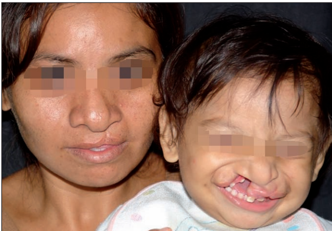
Fig. 12. Mujer de 21 años de edad con labio y paladar hendido izquierdo con su hija de 9 meses con labio hendido bilateral, ya reparado en otro centro el lado izquierdo.

pacientes entre 2005 y 2010 en el Hospital General de Salubridad.