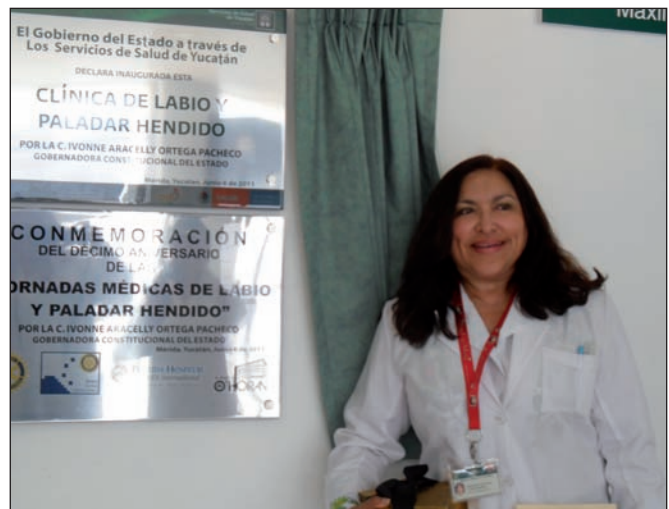
Fig. 2. El 6 de junio de 2011, el Gobierno y la Secretaría de Salud del estado inauguraron la Clínica de Labio y Paladar Hendido del Hospital General “Dr. Agustín O’Horan”. A partir de ese momento tuvimos un espacio físico permanente para trabajar.

A lo largo de sus 17 años de actividad se han realizado en esta clínica del Hospital “Dr. Agustín O’Horan” 18 jornadas quirúrgicas con un promedio de 50 a 60 pacientes operados de labio y paladar hendido y/o sus secuelas en cada jornada (Fig. 3). Además, con el apoyo de Sharing Smile y Smile Train hemos llevado a cabo otras 22 jornadas quirúrgicas en otros estados del sureste de la