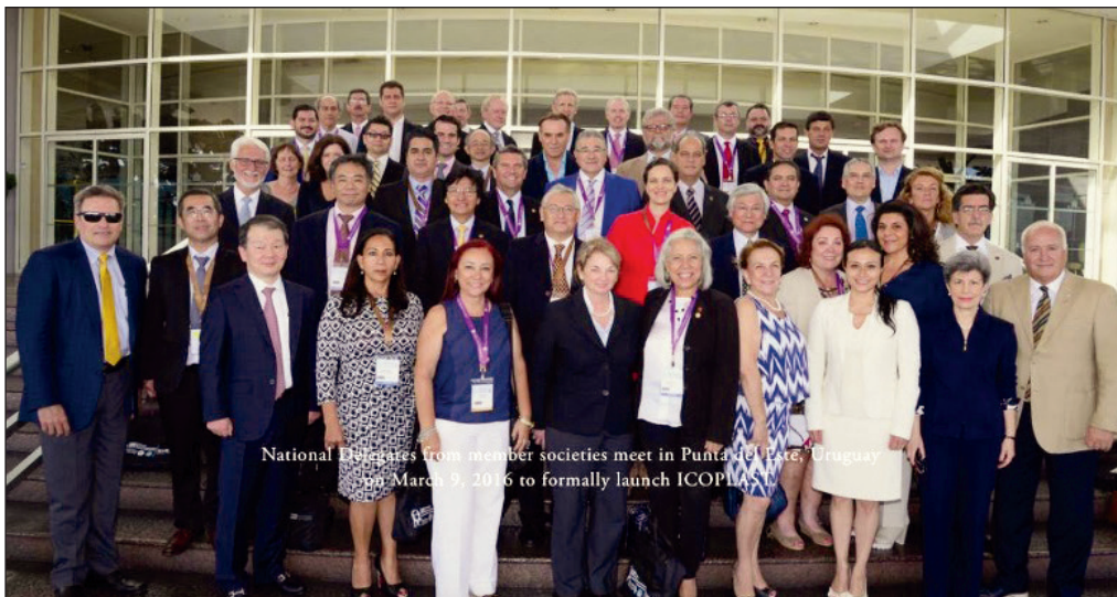
Lanzamiento oficial de ICOPLAST en Punta del Este, Uruguay, el 9 de Marzo de 2016