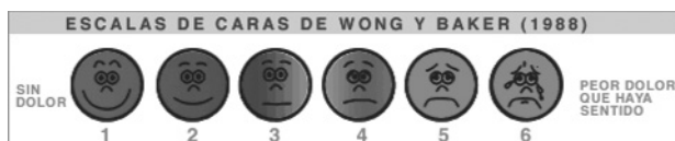
Fig. 1—Escala facial de Wong y Baker.

4. La incidencia de vómitos. Estos parámetros fueron valorados cada 15 minutos, durante 90 minutos.