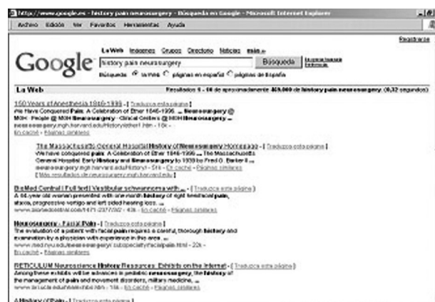
Fig. 1. Pagina de Internet donde se reseña la conmemoración del nacimiento de la Anestesia.

dolor y no son anestestistas... A ellos va mi mas sincero reconocimiento, independientemente, a que nivel terapéutico actúe cada uno de ellos.