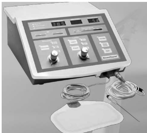
Fig. 5. Generador NT-500.

—NT 500 (Fig. 5): es muy ligero (7 kg), se puede llevar en un maletín pequeño. Dispone de un único puerto para una única lesión, pero esta puede ser convencional o pulsada. Muy sencillo de usar e intuitivo. El display es digital, careciendo de pantalla táctil. Potencia máxima de 25 vatios.