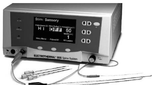
Fig. 11. Generador Electrothermal 20S.