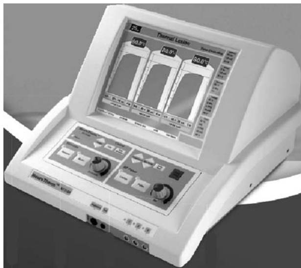
Fig. 6. Generador NT-1100.

—NT1100 (Fig. 6): fue el primer generador de ondas de RF patentado con varios puertos para realizar lesiones. Dispone de tres puertos. Dispone de un software sencillo con un display moderno. Permite realizar lesiones bipolares. Puede almacenar en su memoria las características de lesión de hasta 12 médicos. Puede exportar datos vía dispositivo USB o bluetooth. Permite realizar RF convencional y pulsada. Es compatible con los diversos dispositivos de Neuro-