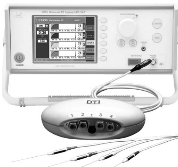
Fig. 9. Generador URF-3A.

—URF-3AP (Fig. 9): gama superior de OWL, permite RF convencional, pulsada y bipolar. Display gráfico multicolor, no táctil. Fácil de usar y muy intuitivo. Compatible con IDET® y Discrode®. Realiza una lesión cada vez, pero se le puede aplicar un adaptador