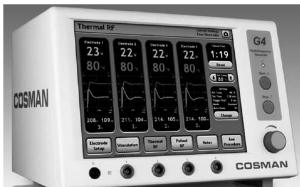
Fig. 4. Generador G4.

—G4 (Fig. 4): es la versión superior de Cosman. Permite hasta cuatro lesiones a la vez tanto en el uso de cánulas acompañadas de electrodo TC con control de temperatura como de aquellas sin control de temperatura y puerto para inyección de anestésico o contraste (modelos CR-x). Puede manejar hasta 100 programas memorizados. Permite RF convencional, pulsada y bipolar (pudiéndose hacer 2 niveles de bipolar a un mismo tiempo). Puede recoger, almacenar y exportar datos mediante un puerto USB e imprimir los datos directamente o guardarlos en un pen-drive USB. Pantalla táctil, de diseño moderno con display gráfico sen-