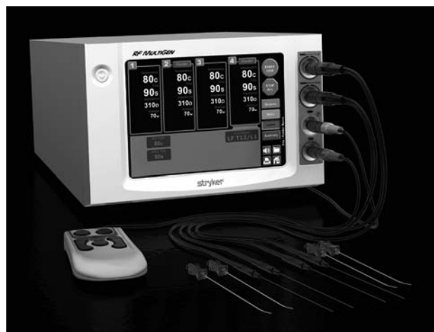
Fig. 10. Generador Multigen.

—Multigen (Fig. 10): generador de pantalla táctil completa (carece de botones). Tiene la especial característica de poder provocar hasta cuatro lesiones con parámetros independientes cada una de ellas. Puede realizar RF convencional, pulsada y bipolar. Peso 8,2 kg y potencia de hasta 50 vatios. Compatible con los sistemas AcuTherm® y SpineCath®. Como hecho diferenciador presenta electrodos de Nitinol, que son más resistentes a las deformidades sin fractura. Presenta mando a distancia pero no es inalámbrico. Presenta control de temperatura en las lesiones bipolares.