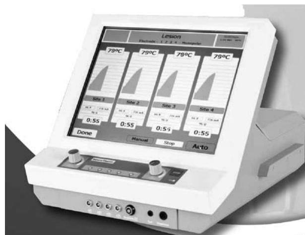
Fig. 7. Generador NT-2000.

—NT2000 (Fig. 7): es la gama superior de Neurotherm. Capaz de realizar hasta cuatro lesiones simultáneamente, cada una independiente. Realiza RF convencional, pulsada y bipolar. Posee la posibilidad de función con mando a distancia inalámbrico. Pantalla táctil de diseño moderno, puerto USB para exportar datos, y posibilidad de conexión a pantalla externa. Capacidad de conectar todos los dispositivos NeuroTherm: Diskit®, Simplicity®. Potencia máxima de 50 vatios. Es también compatible con Accutherm® y Spinecath®. Pesa 10 kg.