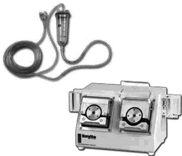
Fig. 2. Unidad de bomba y juego de tubos para la radiofrecuencia enfrizada.

Permite realizar técnicas de RF discales conocida como Biacuplastia© y realizar técnicas de denervación sacroilíaca por medio del sistema Sinergy©. Peso de 7,5 kg. Dispone de electrodos de NiTiNol.