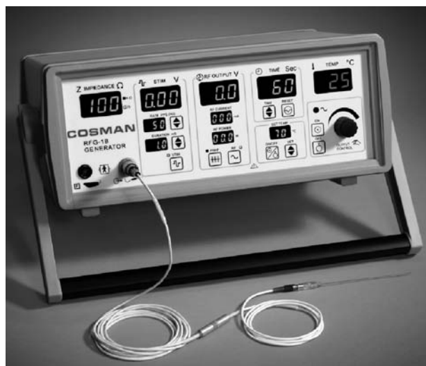
Fig. 3. Generador RFG-1B.

—RFG-1A (para Neurocirugía) y RFG-1B (para Dolor) (Fig. 3), es el antiguo Radionics. Ambos son iguales, salvo el 1-A permite mayor versatilidad de estimulación, en cuanto a programación de parámetros.