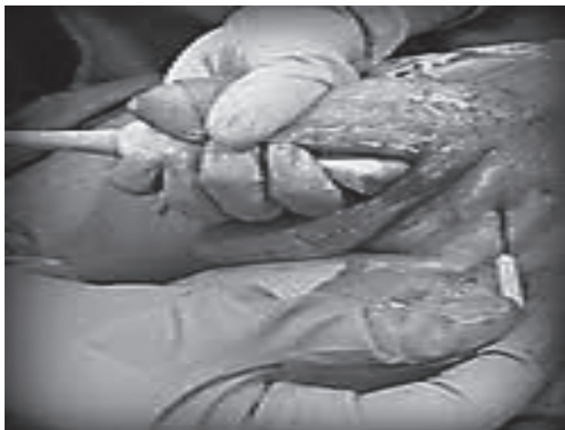
Fig. 2. Punción en plano ecoguiada.