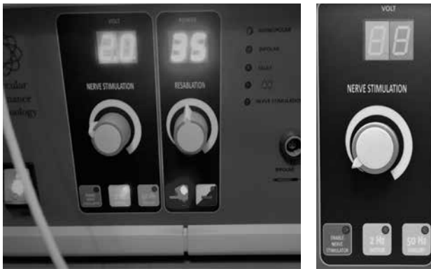
Fig. 1. Nuevo generador de energía que se acoplará al Resaflex®. Nótese las características en el generador que permiten realizar estimulación y radiofrecuencia coablativa. En detalle se aprecia que se permite realizar estimulación motora (2 Hz) y sensorial (50 Hz).