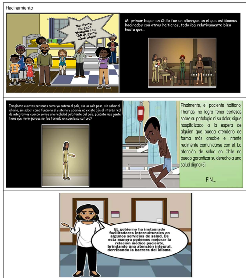
Figura 2. Realidades socio-sanitarias que experimentan en Chile personas haitianas.

luación, no es lo que un estudiante de medicina espera escuchar de sus docentes ni mucho menos está habituado a hacerlo. Por esta causa, al inicio fue desconcertante y aburrido en teoría. Respecto del trabajo en equipo, esto es relativamente habitual dentro de los primeros años de carrera y se postula como un elemento de desempeño clave de la Escuela de Medicina.