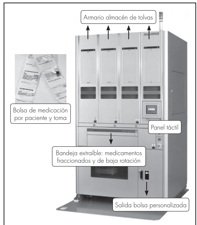
Figura 1. Imagen de la Xana 4001U2 con identificación de las diferentes partes del sistema e imagen de la Bolsa film políester personalizada por paciente y toma.

Como complemento al SADP se dispone de un sistema de comprobación automatizada (SCA) MDM2 Global Factories ® (Figura 2), que verifica el contenido de las bolsas previamente fabricadas por el SADP realizando una lectura de código de barras y la toma de una fotografía de cada bolsa. Las alarmas generadas por el SCA son revisadas manual-