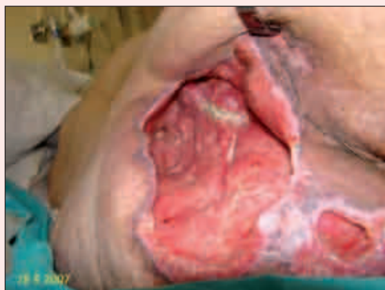
Fig. 4. Aspecto de la lesión a los 28 días del inicio del desbridamiento. En la imagen se observa una gran mejoría en el aspecto de la lesión, se ha conseguido limpiar la herida ampliamente y se ha obtenido una proliferación extensa del tejido de granulación.