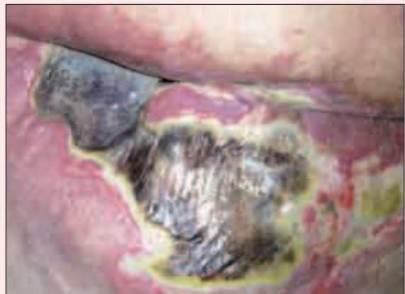
Fig. 1. Imagen inicial en el momento del ingreso. En ella se observa una escara extensa con zona esfacelar, eritema y maceración en la zona perilesional.

Considerando el estado clínico de la paciente, tanto desde el punto de vis-