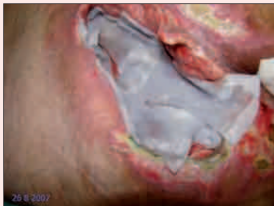
Fig. 3. Imagen a los 5 días de inicio de la pauta de curas con Aqualcel® Ag y Prontosan®. Ha sido tomada después de la realización de la cura y se puede observar la colocación del apósito impregnado en la solución de polihexanida.

El desbridamiento de una herida constituye un procedimiento ineludible para conseguir la cicatrización de una lesión crónica. Mediante la presente pauta de desbridamiento, hemos conseguido un