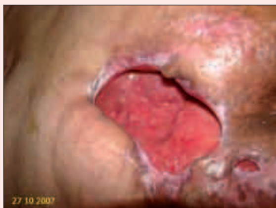
Fig. 5. Imagen a los 67 días de inicio de la nueva pauta de curas. Se observa la reducción importante en el tamaño de la lesión, así como la proliferación del tejido de granulación y la epitelización de algunos márgenes de la lesión.

desbridamiento amplio y muy rápido de la lesión. Con la aplicación de esta