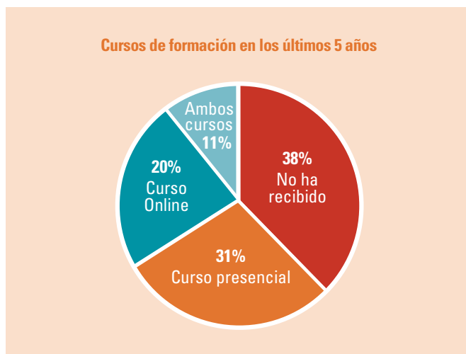
Figura 1. Resultados sobre la asistencia a cursos de formación en los últimos 5 años (ítem 10 del cuestionario).

Hasta el momento no se han encontrado en la bibliografía otros estudios que hayan abordado el conocimiento de las UEI en los diferentes niveles