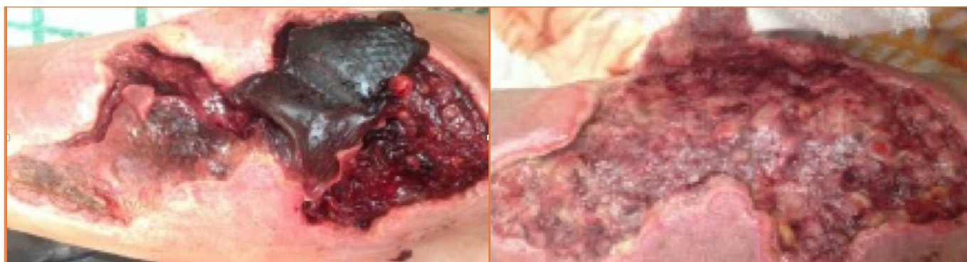
Figura 2. Décimo y decimoséptimo día de cura de úlcera postraumática en región gemelar, miembro inferior derecho.

hidrofibra de hidrocólido/espuma de poliuretano, según las variaciones a lo largo del proceso. Para la protección de bordes se utilizó pasta Lassar.