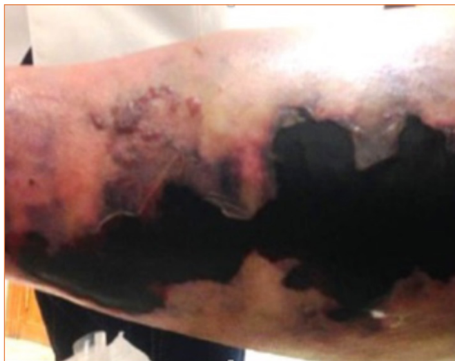
Figura 1. Primer día de cura de úlcera postraumática en región gemelar, miembro inferior derecho.

La paciente es remitida a consulta de enfermería para valoración de lesión postraumática en miembro inferior derecho. A la retirada del vendaje elástico, aplicado hace 7 días, se observa gran hematoma subcutáneo (lecho necrótico seco), de tamaño aproximado 20 × 8 cm (fig. 1), que abarca la región gemelar desde el hueso poplíteo hasta la zona supramaleolar de dicha extremidad. No presenta exudado ni olor. La piel perilesional presenta buen estado.