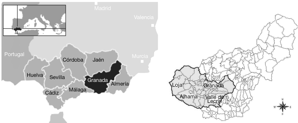
Figura 1. Mapa de situación de la zona de estudio.

formación necesaria sobre los distintos sistemas de abastecimiento de la zona y su origen, además de realizar el contacto con las empresas y ayuntamientos implicados en la gestión del agua en el área de estudio. Previamente a la elección de los puntos de muestreo, se envió a las empresas y ayuntamientos una encuesta sobre el origen, el tratamiento y la calidad del agua potable. Estas encuestas fueron diseñadas ad hoc dentro de los protocolos establecidos por la Red INMA. En ellas se recoge información básica acerca del tratamiento, el suministro y la calidad del agua potable. El 70% de las encuestas enviadas a ayuntamientos y empresas municipales fueron cumplimentadas y devueltas.