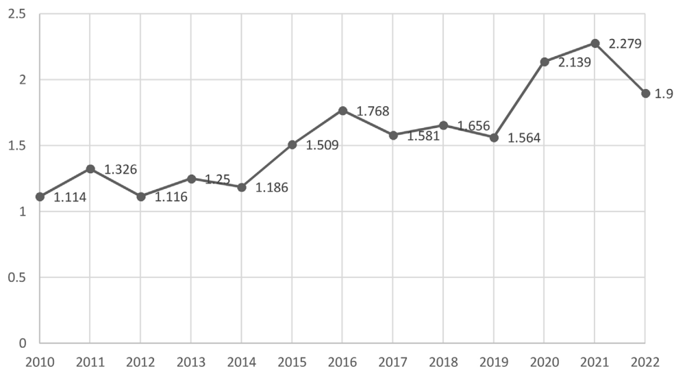
Figura 2. Evolución del factor de impacto (2010-2023). Fuente: JCR.

El canal de YouTube de GACETA SANITARIA aumentó su número de personas suscriptoras a 1350.