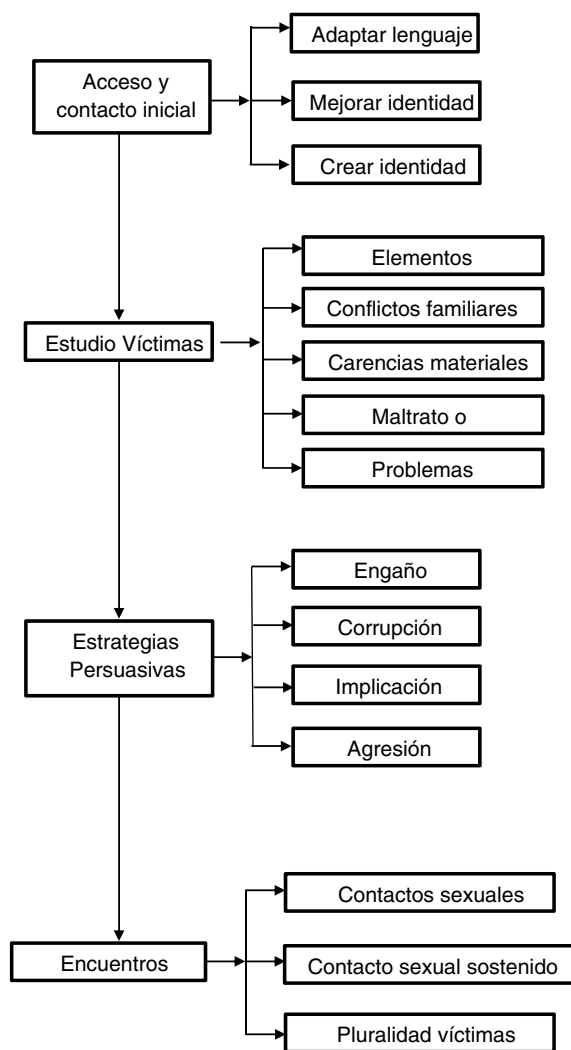
Figura 1. Procesos de persuasión en grooming online .

texto los segmentos pertenecientes a las mismas, y mediante la triangulación por grupo de expertos.