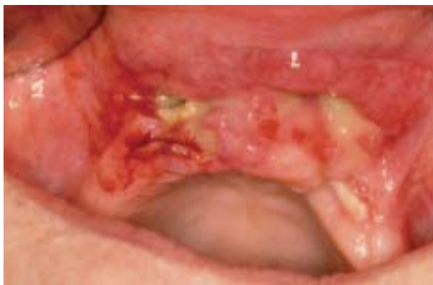
Figura 2. Pérdida progresiva de las piezas dentarias con desarrollo posterior de un trayecto fistuloso entre cavidad oral y zona nasogeniana.

La presentación de linfoma no-Hodgkin de células B asociado a metotrexate es una situación de extrema rareza teniendo una localización extranodal hasta en un 40%, especialmente en el tracto digestivo, pulmón, piel y riñón, y de manera excepcional en el territorio de cabeza y cuello.