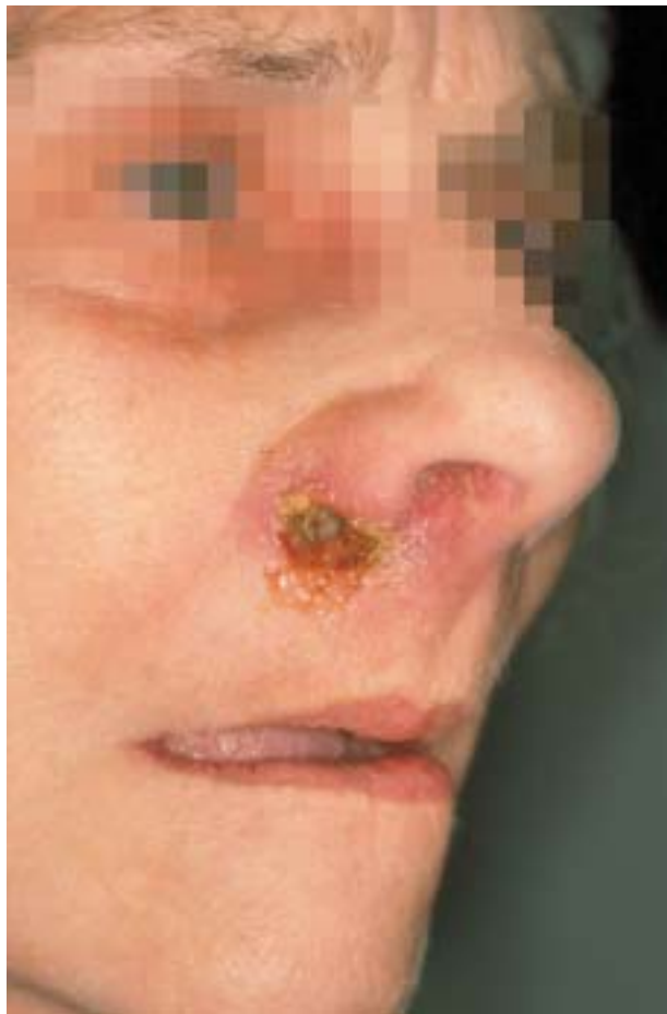
Figura 1. Paciente de 79 años con lesión ulcerada de aspecto necrótico en región nasogeniana derecha.

En la RM se aprecia un aumento de partes blandas en la región labial superior izquierda y un trayecto fistuloso que se extiende desde el maxilar superior izquierdo al surco nasogeniano derecho.