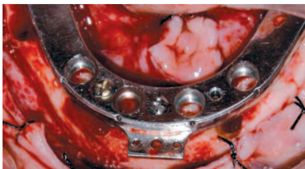
Figura 3. Fijación de guía quirúrgica metálica pre fabricada después del aplanamiento del reborde óseo remanente. Figure 3. Metal surgical guide.

A las 48 horas después de la cirugía se instaló la prótesis mandibular fijada a los pilares por los tornillos protésicos. Durante los primeros de 6 meses la prótesis no fue removida, controlando mensualmente a los pacientes con exámenes clínicos hasta completar 1 año.