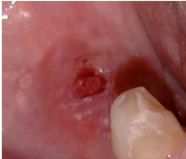
Figura 1. Condición clínica pre operatoria. Figure 1. Pre operative clinical condition.

Una hora antes del procedimiento quirúrgico fue administrado al paciente 2 g de amoxicilina y 4 mg de betametasona. En el post operatorio el paciente tomó amoxicilina 500 mg 4 veces al día durante siete días y tenoxicam 20 mg 1 vez al día por tres días y para el control de placa si indicó colutorios con solución de clorhexidina 0,12% tres veces al día. El examen histológico reveló un tumor bien circuns-