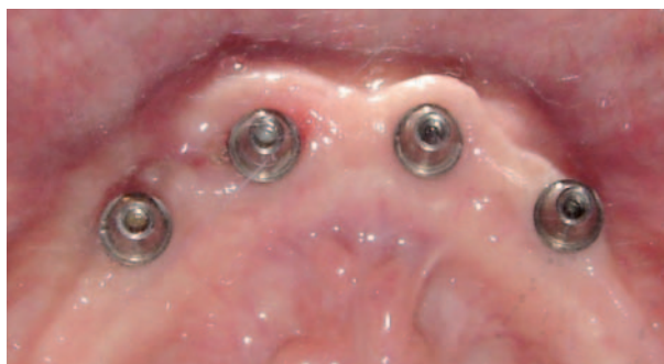
Figura 6. Remoción de prótesis y control de los implantes después de 14 meses.

Figure 5. Post operative panoramic radiograph.