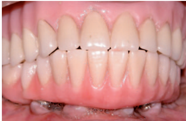
Figura 4. Condición bucal después de 1 semana de instalación de la prótesis.

La presentación de este caso ha demostrado que la utilización de implantes oseointegrados de carga inmediata es posible de efec-