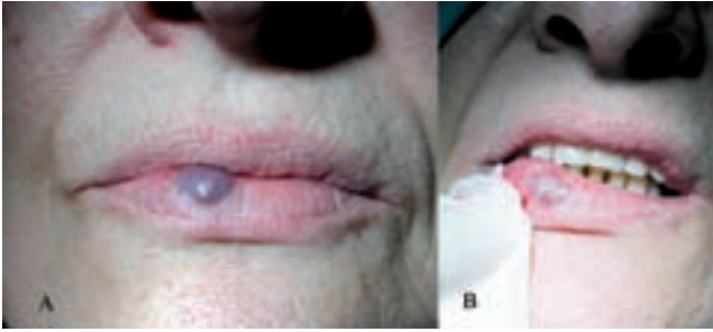
Figura 2 – Malformaciones venosas de bajo flujo en el labio inferior. A. Antes de la escleroterapia. B. Tras finalizar el tratamiento con láser de diodo. Se aprecia un blanqueamiento alrededor de la zona de punción y se objetiva la escleroterapia de la misma.