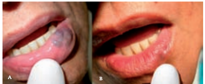
Figura 6. A. Malformaciones venosas de bajo flujo en el labio, pre-tratamiento. B. Control después de 7 días de realizar la escleroterapia endoluminal con láser de diodo. Se evidencia encogimiento de la lesión y cicatrización del punto central donde se realizó la punción.

parte corresponde a MVBF menores de 3 cm de diámetro bidimensional (88,1%). La localización más frecuente fue el labio, seguido de la lengua. El 76,19% de las lesiones se trató con una sola sesión. Un 23,81% precisó de dos o más sesiones para la resolución completa. El intervalo de tratamiento entre sesiones fue de 6 meses. En general encontramos a los 2-3 días del postoperatorio una zona deprimida en el punto