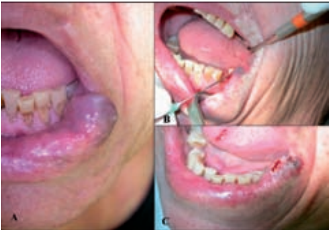
Figura 3 – A. Malformaciones venosas de bajo flujo en la comisura del labio inferior. B. Detalle del momento de la técnica de escleroterapia endoluminal con láser de diodo. C. Zona central muy deprimida tras la escleroterapia. Se aplicó una energía excesiva, se provocó daño térmico y apareció necrosis mucosa.

recer la adherencia de las paredes vasculares de la lesión. El tratamiento postquirúrgico consistió en analgésicos no esteroideos, dieta líquida y fría en el caso de lesiones intraorales, e instrucciones al paciente para que realizase compresión local de la zona de punción con una gasa durante media hora tras la intervención. Se realizó un seguimiento clínico y se tomaron registros fotográficos hasta su completa curación (figs. 3, 4, 5 y 6). El seguimiento medio ha sido de 10-12 meses tras la intervención. En los casos de más de 3 cm de tamaño bidimensional y en aquellos donde la malformación venosa era de morfología irregular o presentaban lesiones satélites se procedió a planificar el tratamiento en sesiones seriadas.