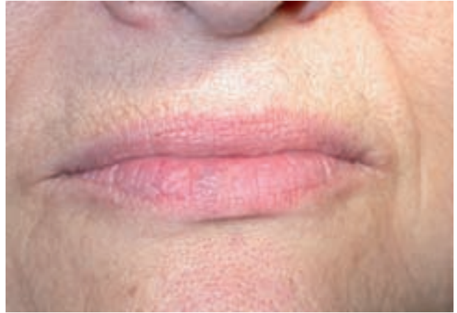
Figura 4 – Paciente de la figura 2 en el control a los 6 meses del tratamiento.

Un total de 90 procedimientos de EELD se han llevado a cabo en los 84 pacientes que integran la muestra (tabla 1). La mayor