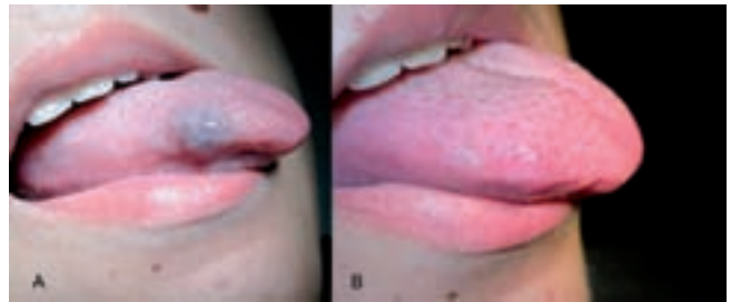
Figura 5 – A. Malformaciones venosas de bajo flujo en la lengua, preescleroterapia. B. Control a los 6 meses de realizar la escleroterapia endoluminal con láser de diodo.