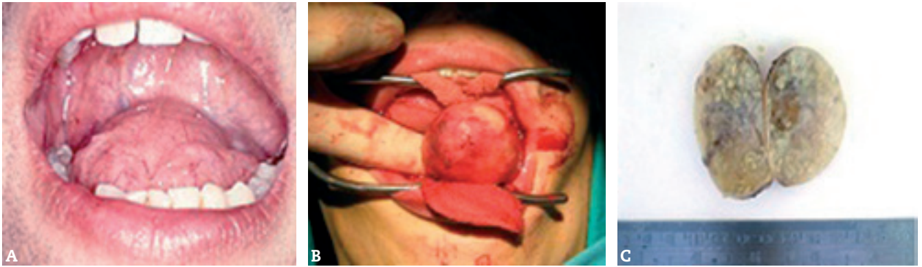
Figura 2 – A) Tumoración sublingual en línea media, de superficie lisa, que se moviliza con la palpación bimanual. B) Exéresis ransoral: incisión vertical del rafe medio sublingual. C) Imagen macroscópica del quiste con un contenido de consistencia pastosa amarillo-grisáceo.

cópicamente se vio un quiste con revestimiento escamoso y queratina en su interior, inflamación crónica en la pared con reacción granulomatosa a cuerpo extraño, sin estructuras glandulares ni parénquima.