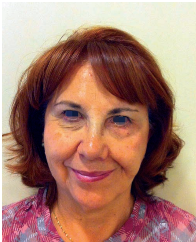
Figura 6 - Visión frontal en sonrisa a las 6 meses del postoperatorio.