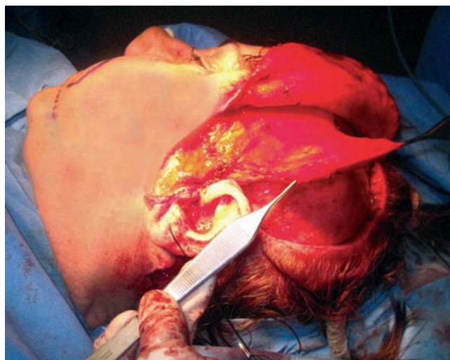
Figura 2 - Colgajo de músculo temporal tras la desinserción completa de la porción posterior en la fosa temporal.

Dada la edad de la paciente y sus expectativas, se optó por la técnica de mioplastia de elongación del temporal de Labbé 5 para rehabilitar la sonrisa.