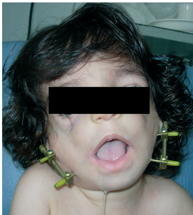
Figura 5 – Síndrome de Treacher-Collins. Sobrecorrección y mordida abierta anterior.

Todos los pacientes presentaban fisura palatina. En tres de ellos se ha realizado reparación de la fisura palatina con veloplastia intravelar tras distracción osteogénica mandibular, sin ninguna complicación.