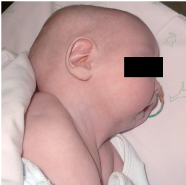
Figura 3 – Secuencia de Pierre Robin. Alimentación con sonda nasogástrica

Se trató a 4 pacientes entre los 3,5 y los 16 meses: dos con secuencia de Pierre Robin, uno con síndrome de Threacher-Collins y otro con síndrome de Cornelia de Lange. Se realizó distracción mandibular osteogénica unidireccional, con distractores externos de Molina. No hubo que someter a ninguno de los 4 pacientes a traqueostomía durante sus episodios de