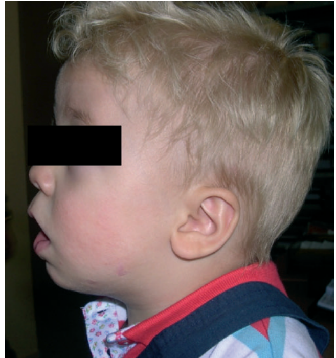
Figura 7 – Niño de la figura 4 a los 18 meses posdistracción.

Esta técnica es una buena alternativa a la traqueostomía en pacientes neonatos con problemas de apnea obstructiva grave. Las indicaciones para realizar la distracción mandibular se van ampliando al mejorarse la técnica, por lo que se