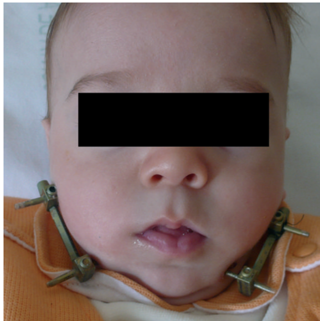
Figura 4 – Secuencia de Pierre Robin en período de distracción ósea.