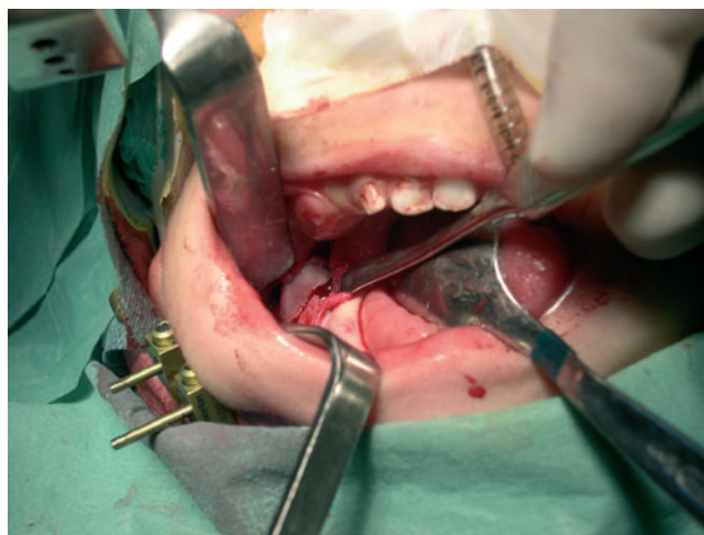
Figura 2 - Corticotomía en área retromolar. Inserción del distractor externo.

Todo ello se realiza de forma bilateral, y por último se insertan de forma percutánea 2 clavos a cada lado de corticotomía. Estos son siempre bicorticales, y mediante palpación digital debe controlarse la cara lingual de la mandíbula. Deben quedar muy estables para evitar una complicación relativamente frecuente, como es la pérdida de los clavos