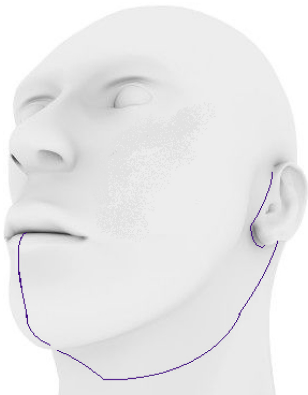
Figura 1 – Delineado del abordaje.

los pares craneales y que logre acceder a la totalidad de la tumoración a resecar.