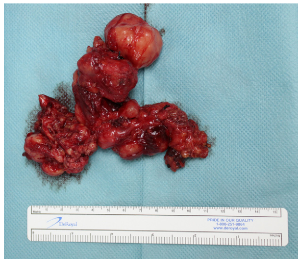
Figura 4 - Pieza quirúrgica.