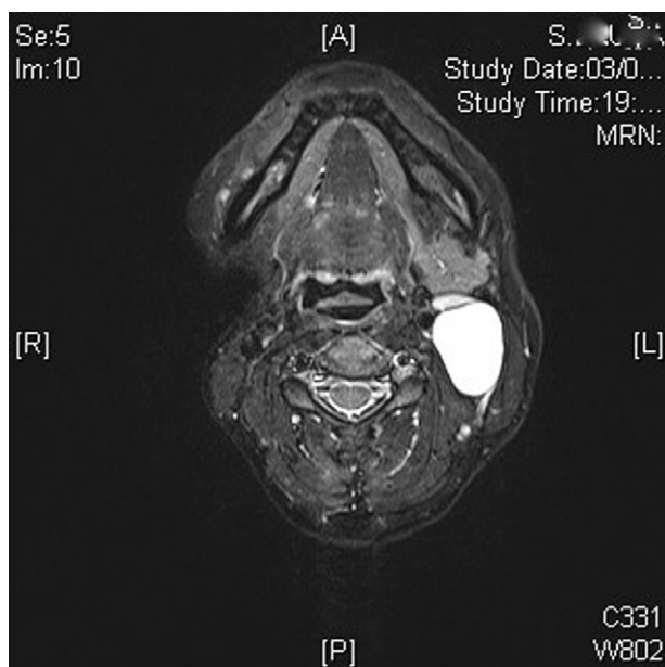
Figura 1 – Corte axial de RNM identificando quiste medial a músculo ECM, hiperintenso en secuencia T2.

Tras dos años de revisiones clínicas y radiológicas (TC y RNM) según protocolo, aparece, en una RNM de control,