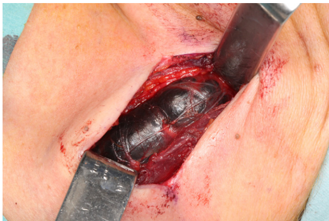
Figura 1 – Visión intraoperatoria de la metástasis quística de color negruzca y tabicada.

postoperatorio con yodo radiactivo está restringido por ley, la mayoría de cirujanos llevan a cabo vaciamientos cervicales profilácticos o selectivos centrales (área VI), aunque hoy en día no exista en la literatura una evidencia definitiva de que estos vaciamientos profilácticos disminuyan las tasas de recurrencia y de mortalidad 3,5-9 .