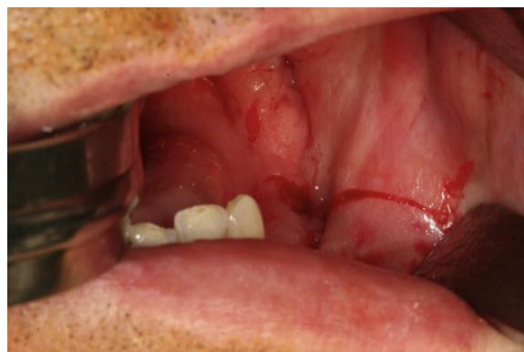
Figura 1 – Fotografía clínica preoperatoria. Imagen de la encía mandibular de aspecto normal sin ulceración ni supuración a nivel del tercer cuadrante. En la palpación se apreciaba un ligero abombamiento de la cortical mandibular.

Varón de 59 años de edad sin antecedentes personales de interés derivado a nuestras consultas por dolor e inflamación en la hemimandíbula izquierda de semanas de evolución. En la anamnesis inicial el paciente refiere exodoncia de molares en la región del tercer cuadrante 2 meses previos al inicio de los síntomas. La exploración física reveló una mucosa de aspecto normal, sin ulceración ni supuración, ligeramente dolorosa a la palpación y acompañada de abombamiento vestibular (fig. 1). No se evidenció parestesia o anestesia del territorio del nervio dentario inferior. La ortopantomografía (OPG) reflejaba una lesión radiolúcida en la región mandibular izquierda, de forma irregular, sin límites claros, desde el cuerpo mandibular izquierdo hasta la región condilar con crecimiento paulatino. La tomografía computarizada (TC) informaba de una importante lesión osteolítica de carácter expansivo que afectaba a prácticamente la totalidad de la hemimandíbula izquierda con rotura de la cortical y un aumento de la densidad del tejido celular subcutáneo (fig. 2). Con tales hallazgos se decide la obtención de varias muestras histológicas mediante la toma