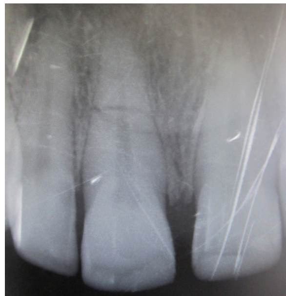
Figura 2 – Radiografía del incisivo superior con fractura radicular del tercio medio.

Desde el punto de vista epidemiológico los resultados publicados anteriormente son variados y, en general, concuerdan