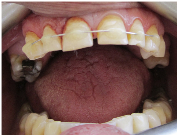
Figura 3 - Ferulización provisoria de una fractura radicular en un paciente con indicación de extracción dentaria e implante inmediato.

con los obtenidos en este estudio en la prevalencia del TDA y el porcentaje de estos que corresponden a FR. Wright et al. describen un 6,3%, mientras que Andreassen et al. postulan entre un 0,5 a un 7%. También coinciden en el tipo de causas que producen el TDA, siendo el golpe con un objeto y el accidente de trayecto lo más común (63,4%) pero difieren de muchos otros por ser publicaciones basadas en estudios de población menor y adolescente donde las causas más comunes de TDA son por la práctica de deportes y caídas sufridas en los primeros años de vida 10 .