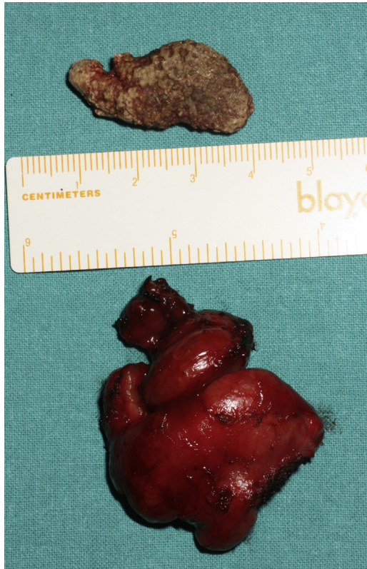
Figura 2 – Litiasis y glándula submaxilar derecha.

adenoma pleomorfo, adenoma oncocítico y adenoma de células basales, representando 28 casos. El adenoma pleomorfo es el tumor aislado con mayor frecuencia (26 casos), representando un 92,8% de los tumores benignos. La edad media fue de 48,6 años, con un pico de incidencia entre los 41 y 50 años. La proporción entre varones y mujeres fue de 1:2,1. Hubo un caso de adenoma oncocítico en un varón de 45 años. Una paciente de 51 años presentó un adenoma de células basales.