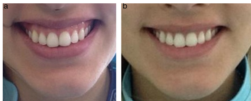
Figura 1 – Foto extra oral del caso. a) Sonrisa inicial mostrando una exposición considerable de tejido gingival. b) Sonrisa en la evaluación postoperatoria de 2 semanas posterior a la aplicación de BTX-A.

negativamente a la estética de la sonrisa y pueden estar relacionados con la acción individual y conjunta de diferentes factores etiológicos. La evaluación estética y funcional del paciente en este tipo de casos debe incluir un examen extraoral, labial, dental y periodontal. La sonrisa es una de las expresiones faciales más importantes de la cara y, para ser considerada hermosa, atractiva y saludable, implica un equilibrio entre la forma y la simetría de los dientes, los labios y las encías, así como la forma en que se relacionan y armonizan con la cara de los pacientes 1 .