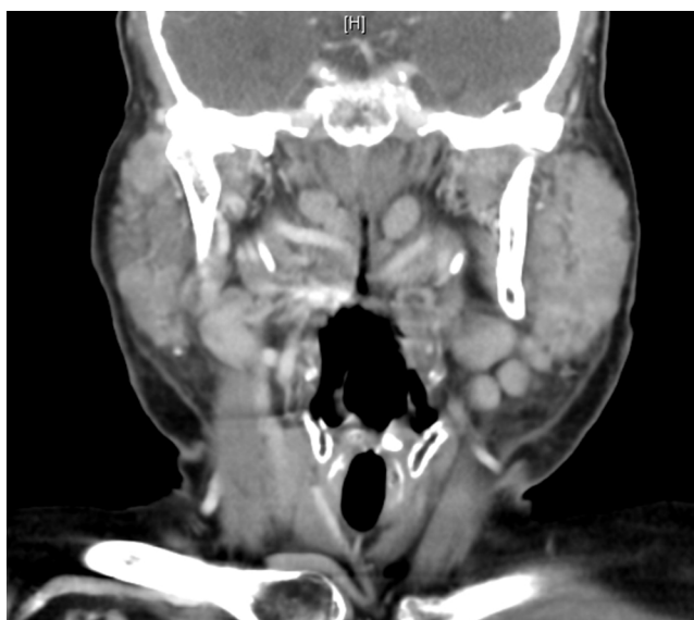
Figura 3 – TC con masa parotídea bilateral con adenopatías.