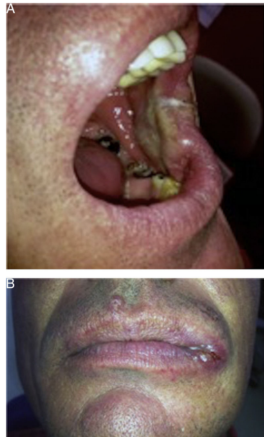
Fig. 1 a. 1 b – Lesión clínica en mucosa yugal (A) y Comisura izquierda (B).

La biopsia incisional fue confirmatoria de leishmaniasis debido a la visualización directa de amastigotes, forma