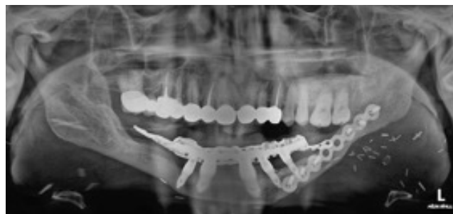
Figura 3. OPG con IOI sobre injerto libre junto con prótesis híbrida.

La corticoterapia fue utilizada por primera vez por Jacoway y cols. en 1988. La hipótesis que defendían es que los corticoides favorecen la apoptosis de células osteoclasticas e inhiben la producción de sustancias reabsortivas. Sin embargo, no existen estudios con un adecuado tamaño muestral o con grupo control que demuestren la desaparición completa de las lesiones a largo plazo 6 . Por otro lado, existen múltiples teorías sobre la acción de la calcitonina en el GCG. Borges y cols. defienden que proporciona una alternativa a la cirugía en lesiones extensas. Demostraron la reducción del tamaño de las lesiones, sin embargo, este tipo de terapia ha de ser comple-