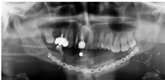
Figura 2. OPG postoperatorio inmediato de injerto libre microquirúrgico de peroné.

La corticoterapia fue utilizada por primera vez por Jacoway y cols. en 1988. La hipótesis que defendían es que los corticoides favorecen la apoptosis de células osteoclasticas e inhiben la producción de sustancias reabsortivas. Sin embargo, no existen estudios con un adecuado tamaño muestral o con grupo control que demuestren la desaparición completa de las lesiones a largo plazo 6 . Por otro lado, existen múltiples teorías sobre la acción de la calcitonina en el GCG. Borges y cols. defienden que proporciona una alternativa a la cirugía en lesiones extensas. Demostraron la reducción del tamaño de las lesiones, sin embargo, este tipo de terapia ha de ser comple-