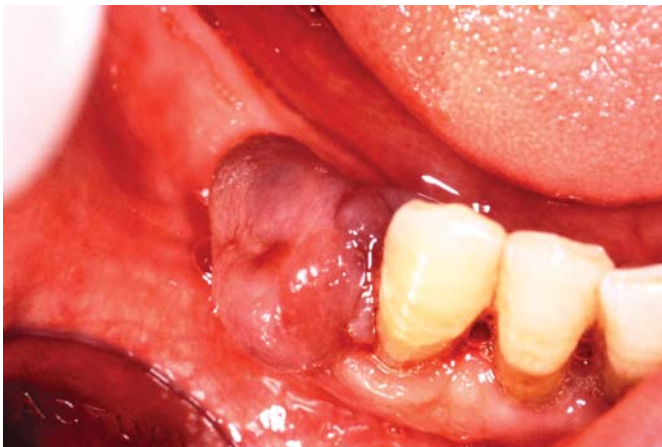
Fig. 3. Imagen clínica de lesión exofítica de 1.5 x 1.2 cm, localizada en reborde alveolar edéntulo del 4.4 (Caso 3). Clinical view of an exophytic lesion measuring 1.5 x 1.2 cm and located in the edentulous alveolar ridge zone of 4.4 (Case 3).