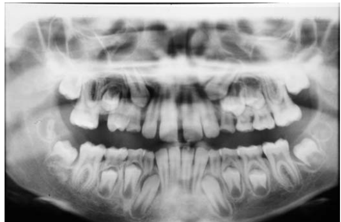
Fig. 4. Ortopantomografía de control llevada a cabo de los 2 años donde se aprecia la erupción de los primeros molares permanentes y la neoformación ósea conseguida.

Juvenile ossifying fibroma. Neoformation of mesenchymal type comprised of bone trabeculae and of osteoid type surrounded by an osteoblastic border.