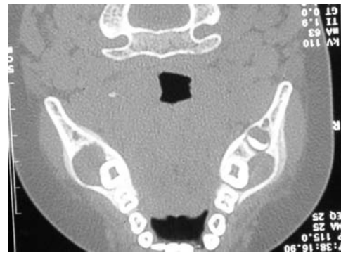
Fig. 2. Corte axial de TC en el que se aprecia insuflación de las corticales externas mandibulares a nivel de los ángulos, sin perforación de las mismas.

Initial panoramic X-ray showing radiolucent images at the mandibular angles and related to the first permanent molars.