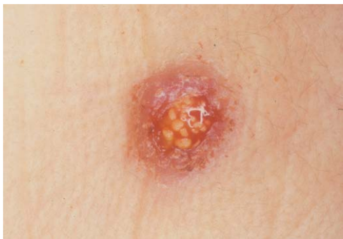
Fig. 3. Infección por Actinomyces a través de un absceso maseterino drenando a piel. Actinomyces infection from a maseter abscess opened to the skin.

Se iniciaron los primeros 15 días en la forma endovenosa a razón de 12 a 18 millones diarios en adultos (y dosis ajustadas por peso en los niños), seguida de tratamiento a largo plazo con amoxicilina oral a razón de 1.5 a 3 gramos diarios.