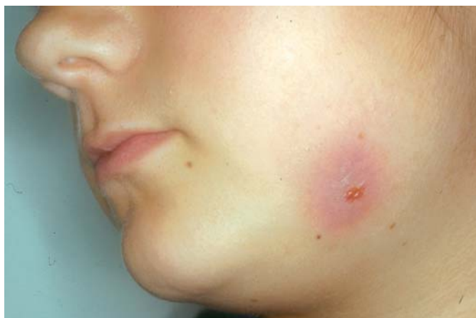
Fig. 1. Tumoración y fístula perimandibular Jaw swelling and fistula