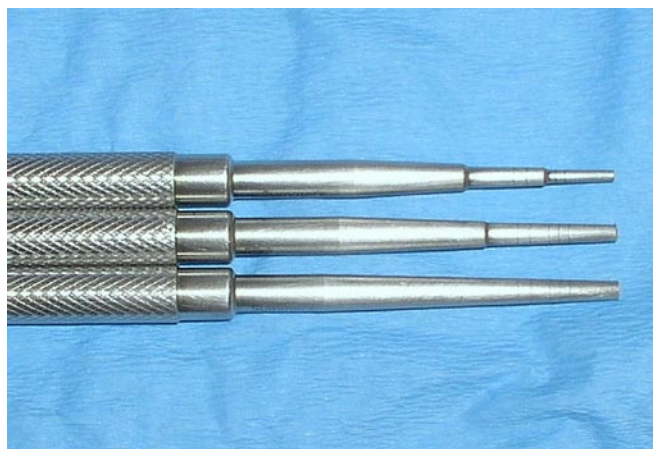
Fig. 2. Osteodilatadores de Summers.