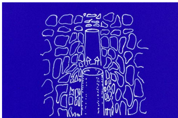
Fig. 1. El osteodilatador produce un hueso más compacto hacia los lados y hacia apical.

En la actualidad existen diversos modelos de osteodilatadores basados en los que Summers describió, pero que incorporan algunas variaciones como el diseño del extremo apical o diferentes calibres, que se adaptan a los sistemas de implantes. También existen osteodilatadores roscados, tanto para el maxilar como para la mandíbula, así como angulados, que permiten mejor acceso en segmentos posteriores.