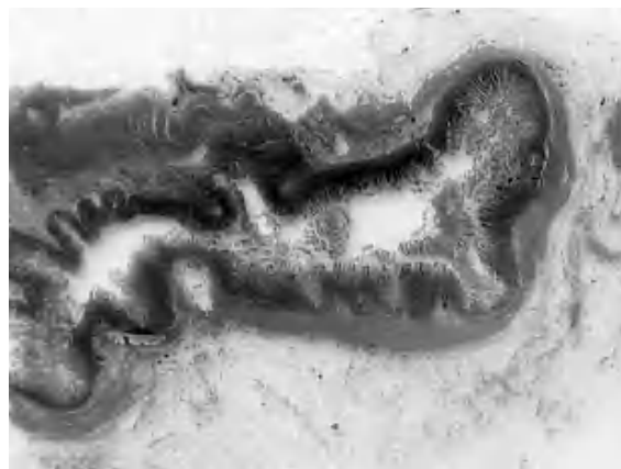
Figura 1. Divertículo yeyunal macro. Herniación de mucosa a través de capa muscular en el tejido adiposo.

En el contexto del postoperatorio inmediato ingresa en nuestra Unidad de Cuidados Intensivos, donde durante las primeras horas se mantuvo en situación de shock , con aporte de volumen y hemoderivados, inotropos (dopamina y noradrenalina), intubado y requiriendo de ventilación mecánica. El paciente fue mejorando progresivamente, recuperando las alteraciones analíticas, pudiéndose retirar apoyo farmacológico y extubar sin incidencias, y siendo alta de nuestra Unidad en el plazo de 10 días, y alta del hospital quince días más tarde.