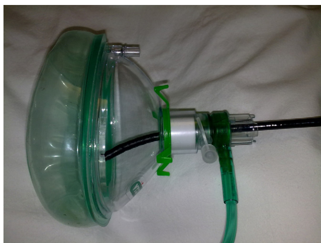
Figura 2 Válvula de Boussignac conectada a una mascarilla. Fibrobronscopia a través de la válvula.

Presentamos 3 casos en los que la realización del procedimiento endoscópico en situación límite (pO 2 /FiO 2 < 150)