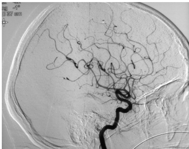
Figura 2 Arteriografía cerebral que muestra imágenes sugestivas de arteritis de pequeño vaso.

damentalmente en la sospecha clínica, la dosis administrada se individualizó a pulsos de 600 mg/m 2 cada 3 semanas.