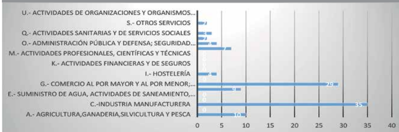
FIGURA 2. NUMERO DE ENFERMEDADES PROFESIONALES DECLARADAS POR SECTORES PROFESIONALES.