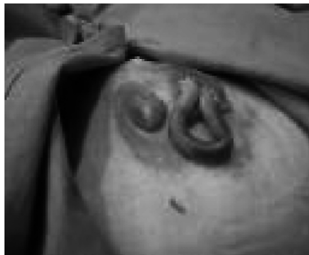
Foto I. Prótesis PTFE al descubierto en muslo

En marzo de 2006 la paciente acude a nuestro servicio desde urgencias por presentar exteriorización espontánea de la prótesis PTFE en extremidad inferior izquierda, de pocas horas de evolución, con signos de infección de la herida, zona inflamada y enrojecida, sin fiebre y sin dolor en la zona afectada. La prótesis queda al descubierto, prácticamente colgando sobre el muslo, la paciente no ha detectado la apertura de la herida ni el comienzo de la exteriorización. (véase foto I y II).